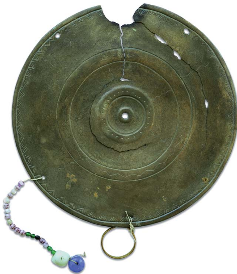
Рис. 1. Бронзовый диск (зеркало).

Ниже антропоморфных фигур выгравированы зооморфные, вид которых определить однозначно сложно. Слева, возможно, изобраа-