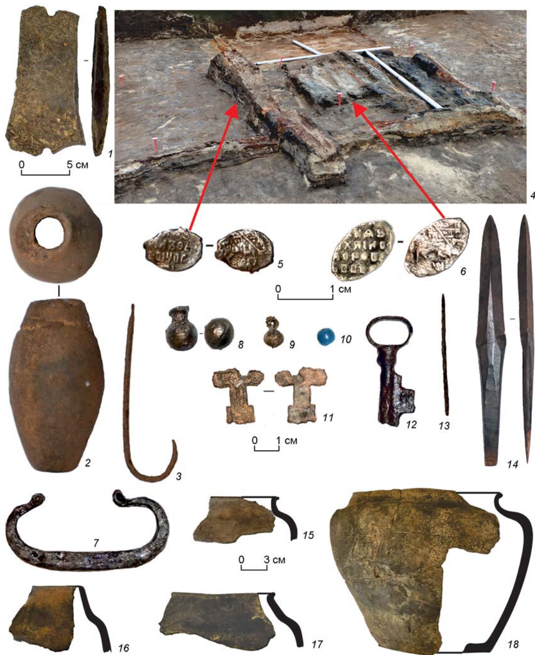
Рис. 2. Поселение Ананьино I. Планиграфия сгоревшего объекта и предметный комплекс XVII и XVIII вв.

1 – каменное грузило; 2 – керамическое грузило; 3 – рыболовный крючок на стерлядь; 4 – планиграфия сгоревшего объекта с указанием расположения монет-чешуек XVII в.; 5, 6 – монеты-чешуйки правления М.Ф. Романова; 7 – калачевидное кресало; 8 – пуля с литником; 9 – гирьковидная пуговица; 10 – бусина; 11 – нательный крест 14 типа; 12 – ключ от шкатулки; 13 – швейная металлическая игла; 14 – костяной наконечник стрелы; 15–18 – керамические формы из сгоревшего объекта.