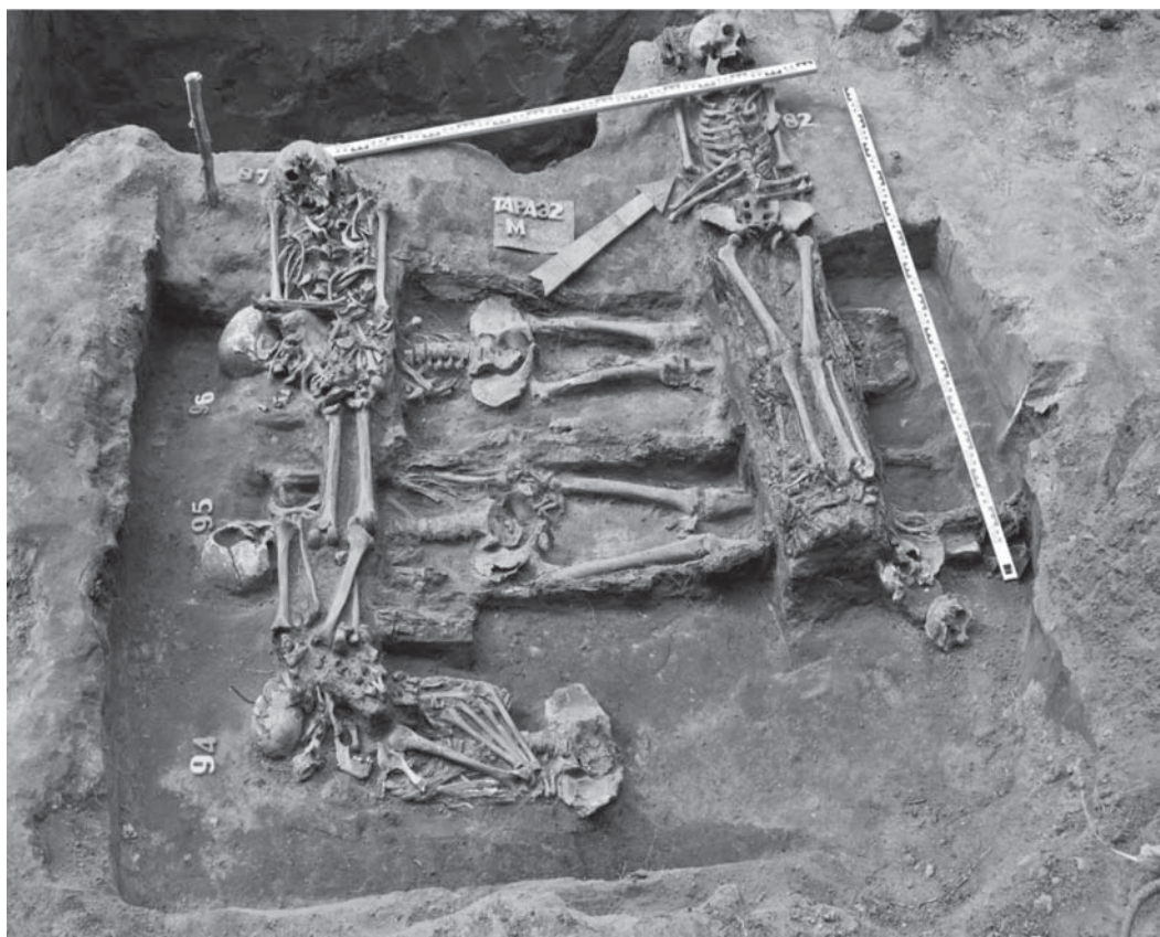
Рис. 2. Коллективное погребение с Успенского прихрамового кладбища.

состояла в удержании города от войск хана Кучума, чтобы затем переломить ситуацию и занять как можно больше земель вверх по Иртышу.