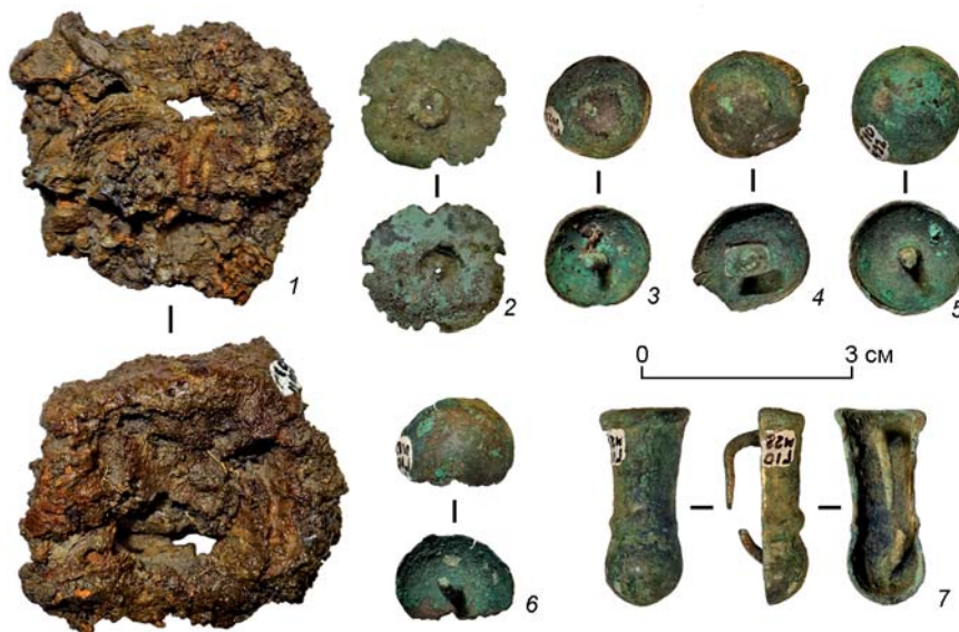
Рис. 2. Детали наборного пояса из могилы 22 некрополя Горный-10. 1 – железо; 2–7 – цветной металл.

Достаточно информативными являются бронзовые полусферические бляхи-накладки округлой формы (диаметр 1,0–1,6 см) с цельными шпеньками (см. рис. 1, Б, 2–6; 2, 3–6). Данные изделия имеют ограниченный круг актуальных ранних аналогий в комплексах Алтае-Саянского региона второй половины VI – первой половины VII в. н.э. (Кудыргэ, Озен-Ала-Белиг, Шибэ), сочетаясь к тому же с рассмотренными выше выпуклыми ложечковидными наконечниками [Гаврилова, 1965, с. 23; Вайнштейн, 1966, табл. IX, 2; Горбунова, 2010, с. 64–65; рис. 31]. Такие украшения могли быть сформированы на основе похожих блях с полусферическим корпусом и вставным штифтом, использовавшихся во второй половине IV – V в. н.э. кочевниками Северного Китая, населением булан-