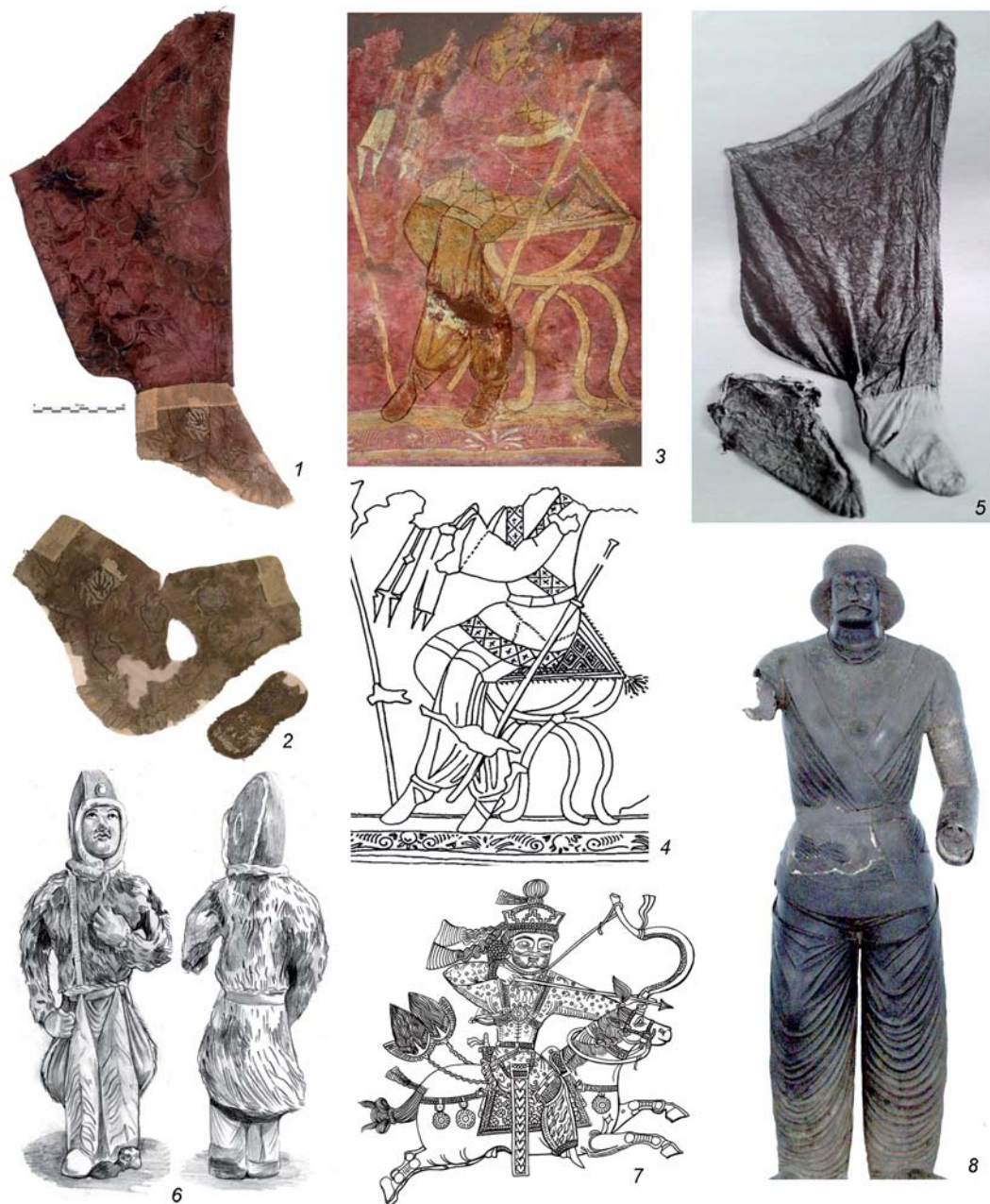
Рис. 3. Ноговицы из Ноин-Улинских курганов и их аналоги.

1, 2 – ноговицы и сапожки из 22-го Ноин-Улинского кургана (шерсть); 3, 4 – фрагмент вышивки шерстяной завесы из 20-го Ноин-Улинского кургана («царь» в курульном кресле) и его прорисовка; 5 – ноговицы и сапожок из 6-го Ноин-Улинского кургана (шелк); 6 – прорисовка глиняной фигурки всадника-чужестранца из погребального комплекса середины VII в. (Шаньси, Китай); 7 – прорисовка изображения на серебряном блюде – охота царя на тигра, VIII в., Эрмитаж; 8 – бронзовая статуя парфянского вельможи из Шами (II–I вв. до н.э., Национальный музей Ирана, Тегеран).