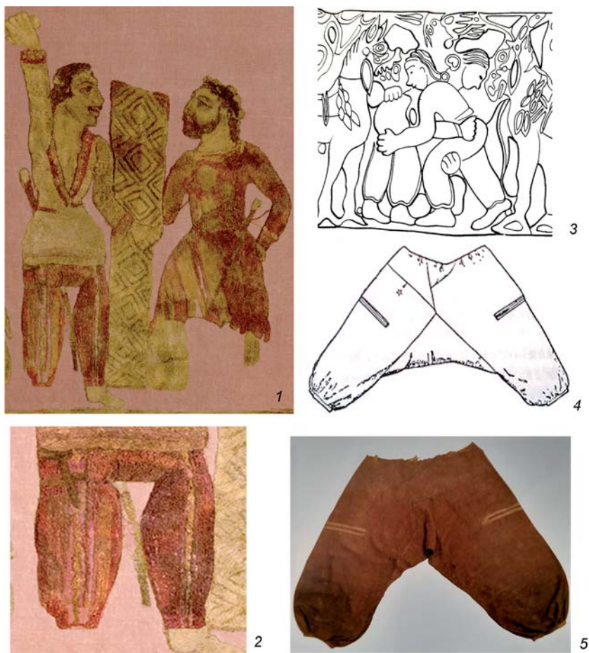
Рис. 2. Шаровары из Ноин-Улинских курганов и их аналоги.

В 22-м Ноин-Улинском кургане были обнаружены такие же ноговицы, как и в 6-м кургане (рис. 3, 1, 2), но сшитые из превосходной шерстяной ткани сирийского производства, а затем расшитые шелком [Полосьмак, 2015, с. 64–87]. Эта находка позволяет вернуться к вопросу о том, откуда появились штаны такого фасона в костюмном комплексе хунну. У представителей этнической группы хань были в ходу расширенные штанины, соединенные на поясе –