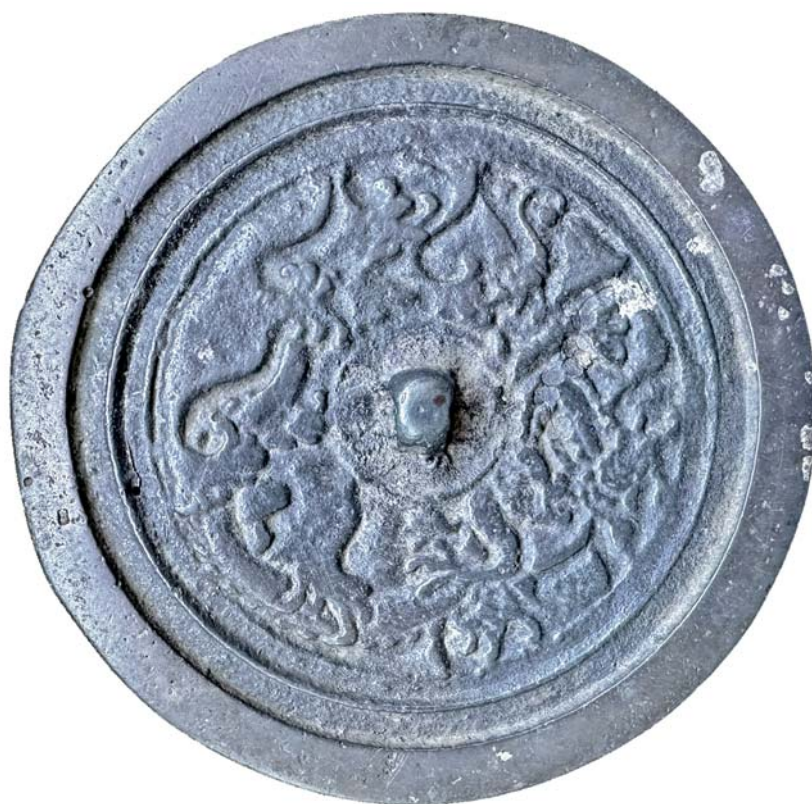
Рис. 1. Бронзовое зеркало из окрестностей с. Черный Ануй на северо-западе Алтая.

кирпичные склепы прямоугольной в плане формы, одно захоронение совершено в кирпичной гробнице округлой формы (погр. 2), погр. 3 представляет собой простую грунтовую яму. В краткой информации о раскопках не указано, из какого конкретно погребения происходит интересующее нас зеркало [Вэй Кэцзин, 1965]. В более поздней обобщающей публикации о находках зеркал из раскопок на территории г. Тяньцзинь говорится, что зеркало с орнаментом в виде стилизованных драконов было найдено в погр. 2 [Ван Юйпин, Ди Мин, 2006, с. 57]. Это погребение представляет собой кирпичную гробницу с округлой в плане погребальной камерой, завершающейся шатровым сводом, и небольшим входным коридором. Высота стен погребальной камеры составляет 0,78 м, диаметр камеры – 2,65 м. Входной коридор длиной 0,6 м и шириной 0,8 м. Вход в гробницу ориентирован на юг, к нему вел наклонный дромос. Вход в гробницу был заложен кирпичом, перед входом захоронена