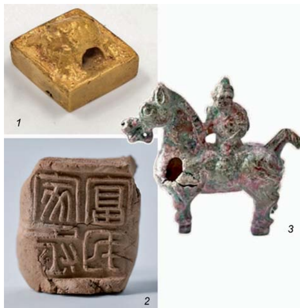
Рис. 2. Находки в гробнице 3 могильника Сяобаоцзы. Подготовлено А.С. Комиссаровым по материалам китайских СМИ: [Лэй Кай, 2005; Чжу Инцэй, Го Цзе, Ван Вэйчжэнь, 2025; Лян Фэйянь, 2005].

1 – золотая печать; 2 – глиняный оттиск печати; 3 – бронзовая фигурка всадника.