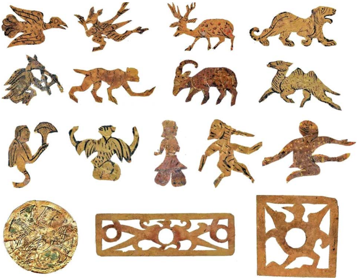
Рис. 3. Украшения из золотой фольги, найденные в элитных гробницах Сяобаоцзы. Подготовлено А.С. Комиссаровым по материалам китайских СМИ: [Лэй Кай, 2005; Чжу Инпэй, Го Цзе, Ван Вэйчжэнь, 2025; Лян Фэйянь, 2005].

[Fitzgibbon, 1914, p. 8–10]. Конечно, от Этрурии до Сяньяна дистанция изрядного размера, но их уже соединил Шелковый путь, и в захоронениях периода Цинь встречается римский экспорт. Впрочем, соединение двух трубок в одном мундштуке не требует сложных технологий и могло быть осуществлено на месте. В-третьих, уникальный «юнипед» представляет «одноногого Куя», мифического персонажа в очеловеченном образе, описанного еще в сочинениях эпохи Чжоу. Однако он держит в руках линчжи , «гриб бессмертия», который считался атрибутом лунного зайца; вероятно, фигурка отражает неизвестный ранее мифологический сюжет.