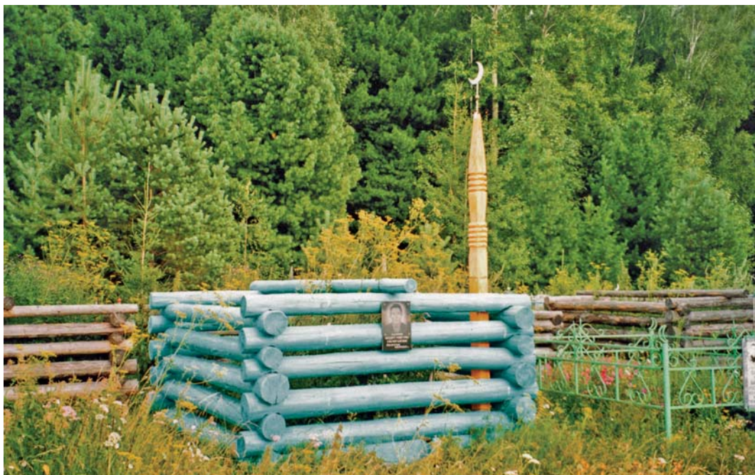
Рис. 2. Могила с орнаментированным столбом, навершие столба заостренное. Деревня Юрты-Супринские Вагайского р-на Тюменской обл. Фото А.Г. Селезнева.

Конечно, на практике данное правило выполнялось не строго; все зависело от технических возможностей, квалификации мастеров и т.п. Случались и довольно существенные трансформации, «размывание» традиции. Так, в с. Второвагай одни информанты сообщали, что столбы устанавливались только на мужских могилах, другие – что эти сооружения устраивались и на мужских, и на женских погребениях. В то же время, в других местах традиционные установки функционировали устойчиво. Например, на кладбище в д. Еланка мы видели столбы, на вершине которых были установлены фигуры в виде гребенки, изготовленные из жестяных пластин. Можно предположить, что по каким-то причинам (утрача соответствующих технологических навыков или отсутствие необходимого инструмента-