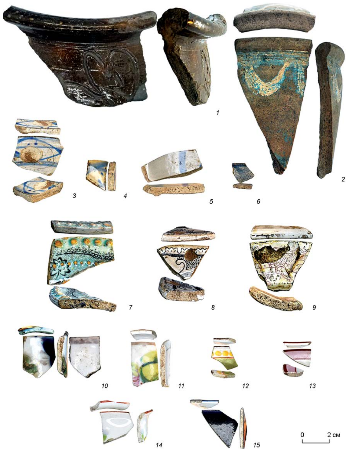
Рис. 1. Фрагменты гончарной и тонкой керамики.

1–2 – гончарная керамика; 3–9 – тонкая керамика первого вида (тарелка, блюдо); 10–15 – тонкая керамика второго вида (чайные чашки, блюда). 3–6 – роспись под гжель; 7 – деколь, рельеф, цветная глазурь; 8, 9 – деколь; 10–15 – роспись, печать.