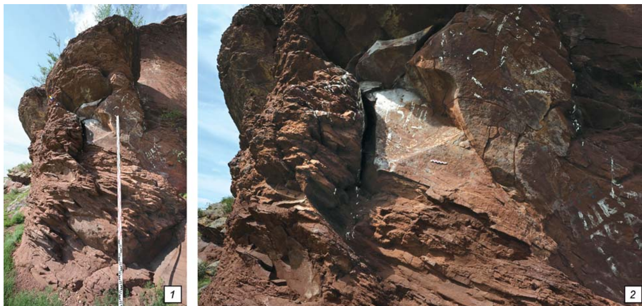
Рис. 1. Новая плоскость с изображением быка, расположенная к западу от самого крупного фриза Писаницы Троицкая. 1 – общий вид на плоскость в контексте ее расположения; 2 – общий вид на плоскость с изображением.