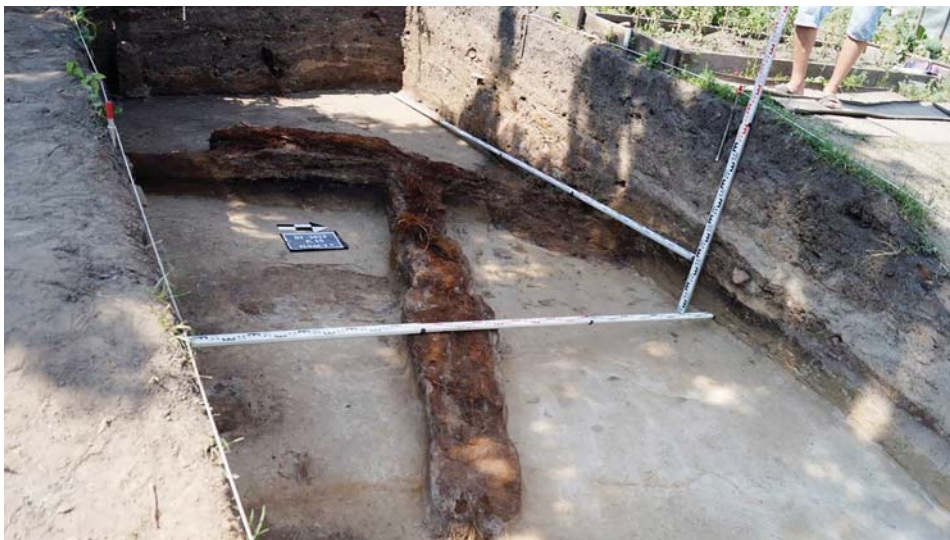
Рис. 2. Воскресенская гора – 2023 г. Раскоп 15. Пласт 6. Фрагмент тарасной ячейки Томского кремля. Вид с юго-востока.