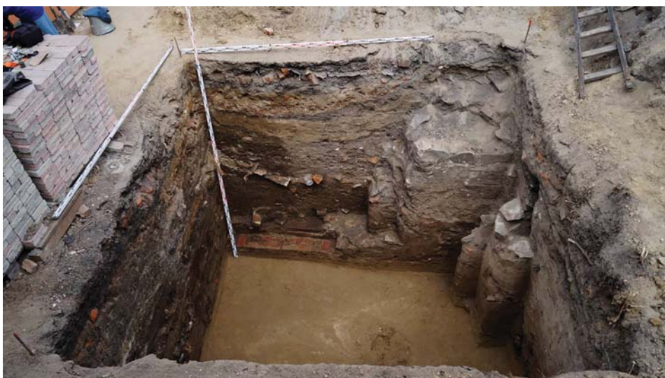
Рис. 3. Воскресенская гора – 2023 г. Раскоп 16. Пласт 14. Вид с юга.

линия восточного прясла действительно отклоняется к востоку, что подтверждает достоверность изображения этой части оборонительной стены на плане 1768 г. и то обстоятельство, что при строительстве кремля в 1647–1648 гг. учитывался рельеф горы. Обращает на себя внимание небольшое заглубление бревен нижнего венца тарас. Это объясняется тем, что на этом участке стена отступала от края горы примерно на 4 м и необходимости укрепления склона внутренним каркасом здесь не было. В отличие от ранее выявленной части стены, идущей по кромке восточного откоса, где нижние венцы вкладывались в специально вырытые траншеи глубиной 1–1,5 м, предназначенные для удержания склона от осыпания [Чёрная, 2002, с. 53]. Таким образом, в границах раскопа 15 удалось проследить продолжение трассы восточной стены кремля и получить материалы, подтверждающие ранее установленную датировку кремлевских укреплений.