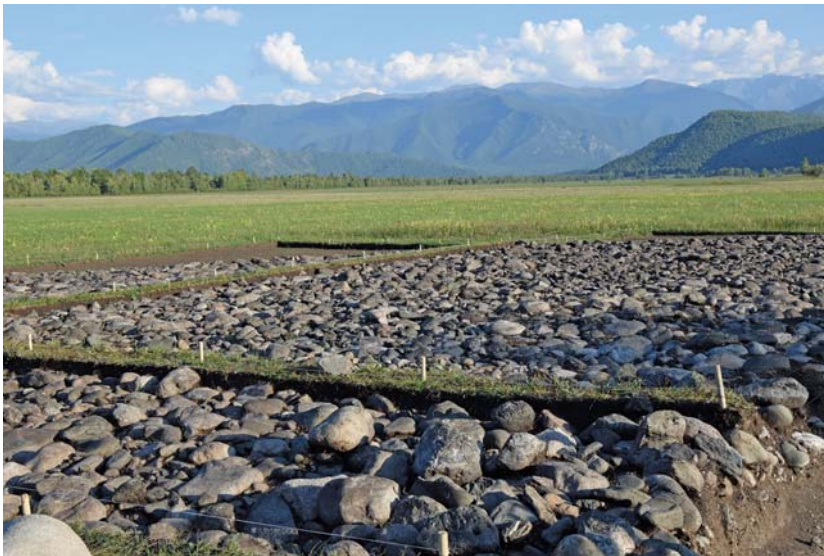
Рис. 1. Вид на юго-восточную часть каменной конструкции погребального сооружения (242) на могильном поле Катанда-3.

В 2023 г. Южноалтайским отрядом были продолжены работы в Катандинской долине на памятнике Катанда-3 (Усть-Коксинский р-н Республики Алтай) [Полосьмак, 2022]. Была зачищена юго-восточная часть каменного сооружения кург. 242 площадью ок. 400 м 2 (рис. 1). Полностью исследована центральная могильная яма, размерами 5,7 м по линии С–Ю и 4,8 м по линии З–В, глубиной от материка 4,08 м, поврежденная древним грабежом и работами по сооружению мелиоративной системы в 1980-х гг. От внутреннего устройства погребения остались только следы деревянной конструкции, которые прослеживались местами в виде тлена. Каменная конструкция внутри могильной ямы из плит и больших валунов была пол-