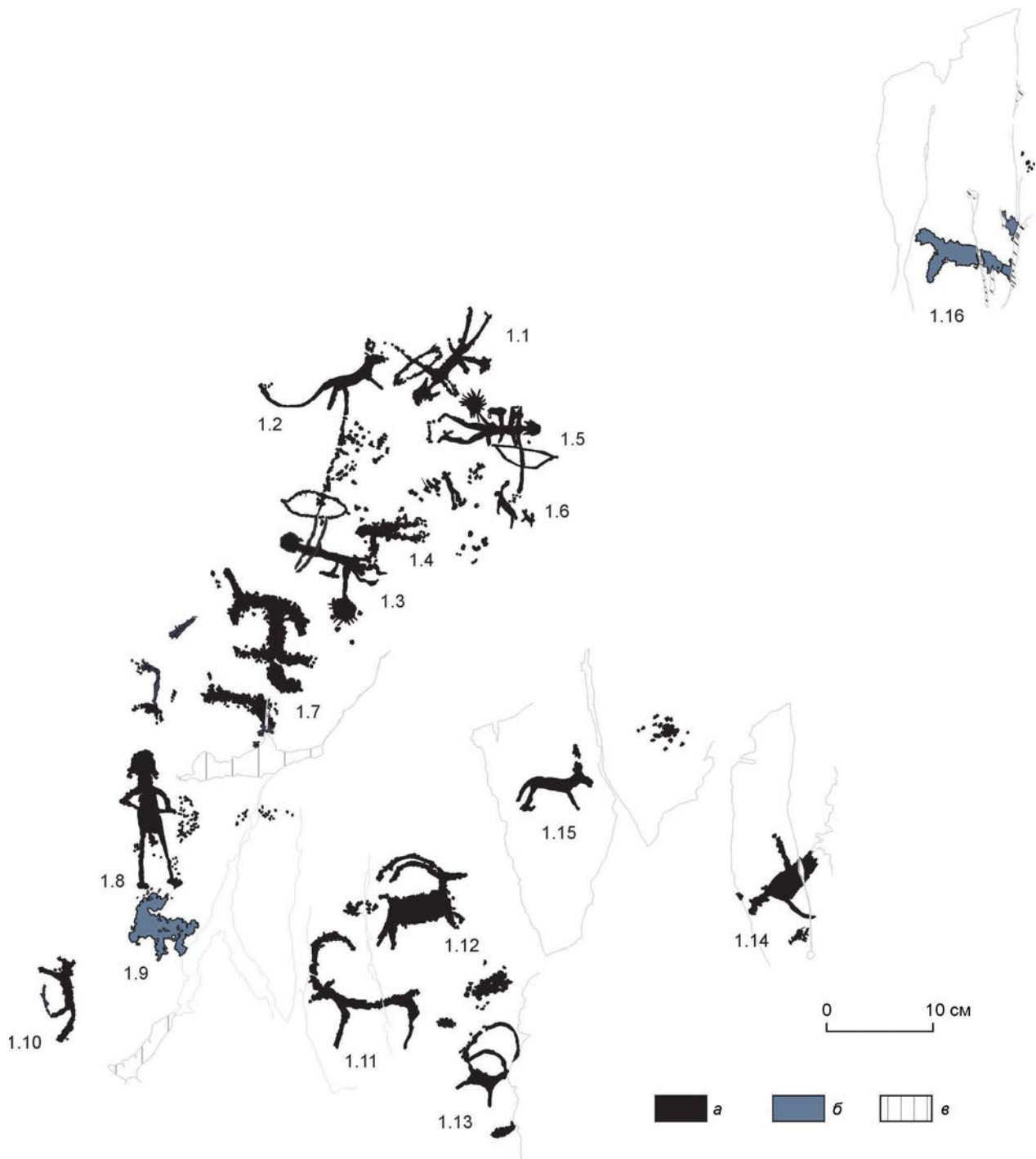
Рис. 1. Монгольский Алтай, пункт Бага-Ойгур-6 (п.б.). Композиция 1, прорисовка. а – эпоха бронзы; б – эпоха железа и Средневековье; в – трещины и лишайник.

жения профильной выбивкой показана еще одна фигура козла (1.12). В самом низу, композицию завершает фигурка еще одного козла (1.13). С правой стороны ее дополняет изображение, вероятно, самки оленя, пораженной в спину копьем (1.14). Фигура передана профильно, с длинной вытянутой шеей, увенчанной небольшой головкой, со слегка выраженными ушками. Задняя нога перекрыта лишайником. В центральной части плоскости нанесено еще одно изображение