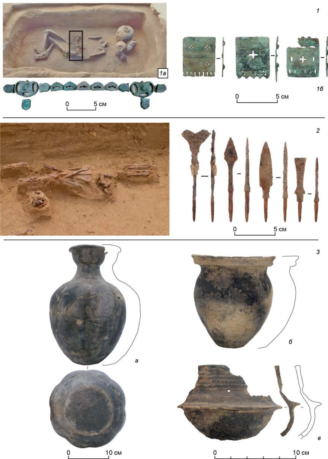
Рис. 2. «Партизанское-3. Могильник». Предметный комплекс.

1 – поясные наборы: 1а – пояс тюрского типа; 1б – бляхи «амурского типа»; 2 – наконечники стрел; 3 – керамический комплекс: 3а – станковый сосуд; 3б – лепной сосуд; 3в – сосуд-реплика металлического котла.