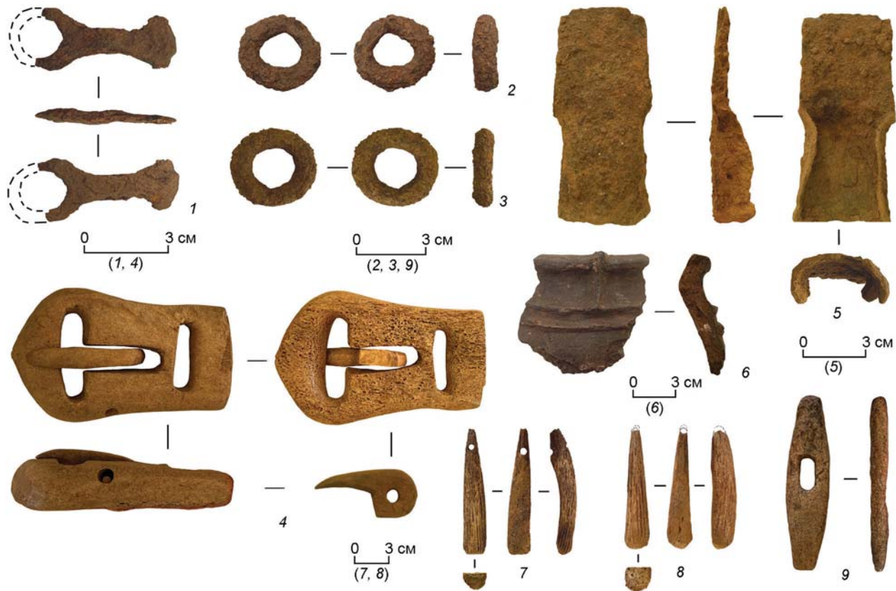
Рис. 1. Курайский могильник, объект 412. Сопроводительный инвентарь из погребения.

1 – блок-пряжка (?); 2, 3 – приторочное (?) кольцо; 4 – подпружная пряжка; 5 – тесло-топор; 6 – фрагмент сосуда; 7, 8 – псалии; 9 – застежка для пут. 1–3, 5 – железо; 4, 7–9 – рог; 6 – керамика.