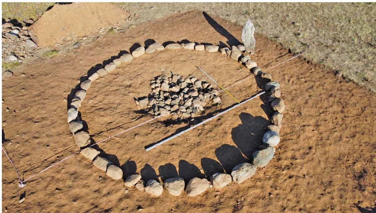
Рис. 2. Курайский могильник, объект 412. Вид на расчищенное кольцо каменной крепиды, стелу и каменное заполнение ямы.

1 – блок-пряжка (?); 2, 3 – приторочное (?) кольцо; 4 – подпружная пряжка; 5 – тесло-топор; 6 – фрагмент сосуда; 7, 8 – псалии; 9 – застежка для пут. 1–3, 5 – железо; 4, 7–9 – рог; 6 – керамика.