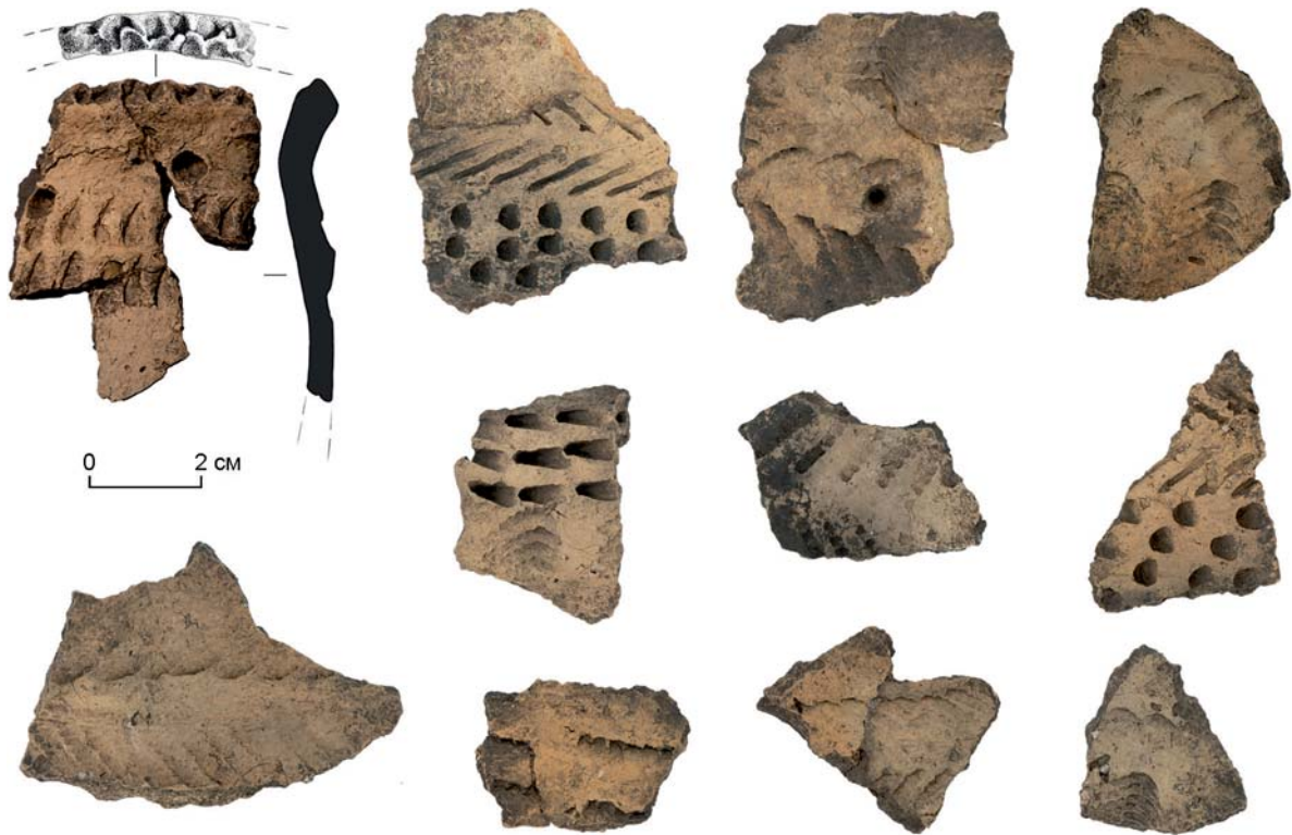
Рис. 2. Фрагменты керамических сосудов с поселения Шеломок V.

Позднее Средневековье является периодом появления письменных источников, которые могут быть использованы при историко-культурных интерпретациях археологических материалов. По мнению З.Я. Бояршиновой, нижнее течение р. Томи населяли мелкие разрозненные тюркоязычные группы, известные в русских документах под общим названием «томских татар» или «томских людей», а занимаемая ими территория в грамоте Бориса Годунова (1604 г.) названа «Томской волостью». Она предполагает, что «томским людям принадлежат курганные погребения в «Тояновом городке», Чернильщиково, Тахтамышево и ряд наземных погребений в Басандайских курганах [Бояршинова, 1950, с. 33]. До прихода русских и основания г. Томска, «томские люди» находились в сфере влияния енисейских киргизов. «Князь Тоян со всеми своими тоянцы» платили им дань, были их «лучшие холопы» [Бахрушин, 1955, с. 180]. Высказывалось мнение и о том, что их территории входили в состав Сибирского ханства в качестве восточной окраины [Левашова, 1950, с. 341]. К югу от города в начале XVII в. обитала одна из групп этого населения, во главе которой стоял князь Басандай. После основания Томска Басандай занял антирусскую позицию, подстрекал киргизов и чулымцев к открытым мятежам, призывал захватить Кетский острог и Томский город [Томилов, 1981, с. 184–185]. По некоторым данным, в 1604 г. Басандай со своими татарами и подошедшими киргизами пытался даже напасть на Томск [Томилов, 1981, с. 192]. Заго-