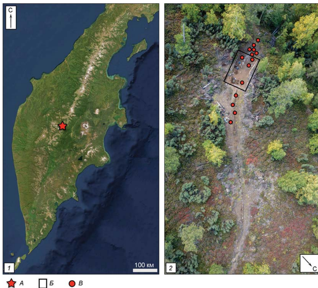
Рис. 1. Карта района полевых работ (1) и стоянка Раздельный II (2).

са высотой 4,5–5,0 м на левом берегу одноименного ручья, впадающего в р. Быструю выше устья р. Анавгай, в 3 км к западу от с. Анавгай (рис. 1, 1) [Пташинский, 2022]. Памятники Раздельный I и II были выявлены в 2006 г. по наличию подъемного археологического материала в обнажениях склона террасы, подрезанного при строительстве автомобильной дороги. Последующие полевые исследования этих объектов позволили получить представление относительно их стратиграфии и хронологии, а также облика пред-