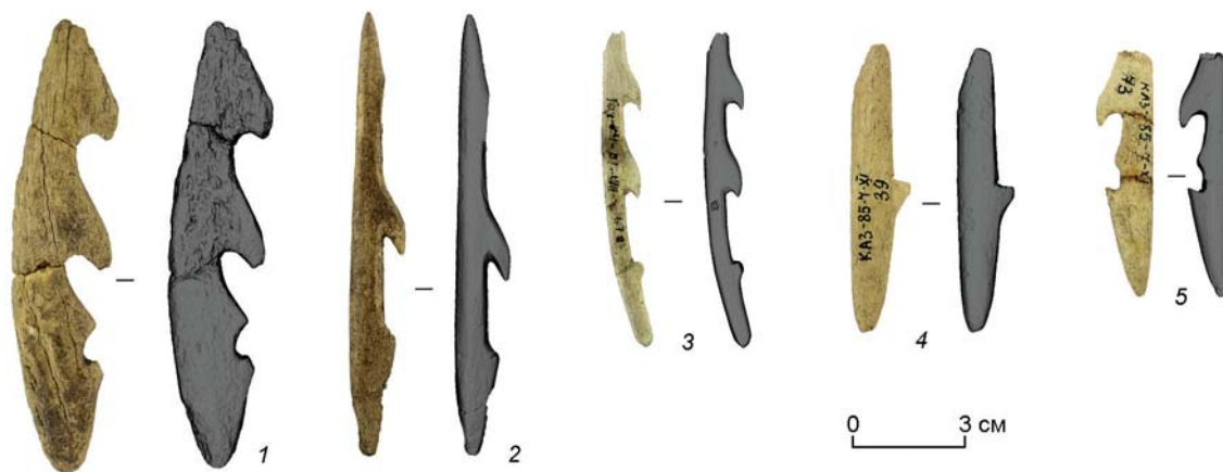
Рис. 1. Зубчатые изделия стоянки Казачка (фото и 3D-модель).

1 – гарпун (№ 669, 12 к.г.); 2 – гарпунная стрела (№ 341, 12 к.г.); 3 – гарпунная стрела (№ 678, 11 к.г.); 4 – гарпунная стрела (№ 39, 12 к.г.); 5 – гарпун (№ 73, 11 к.г.).