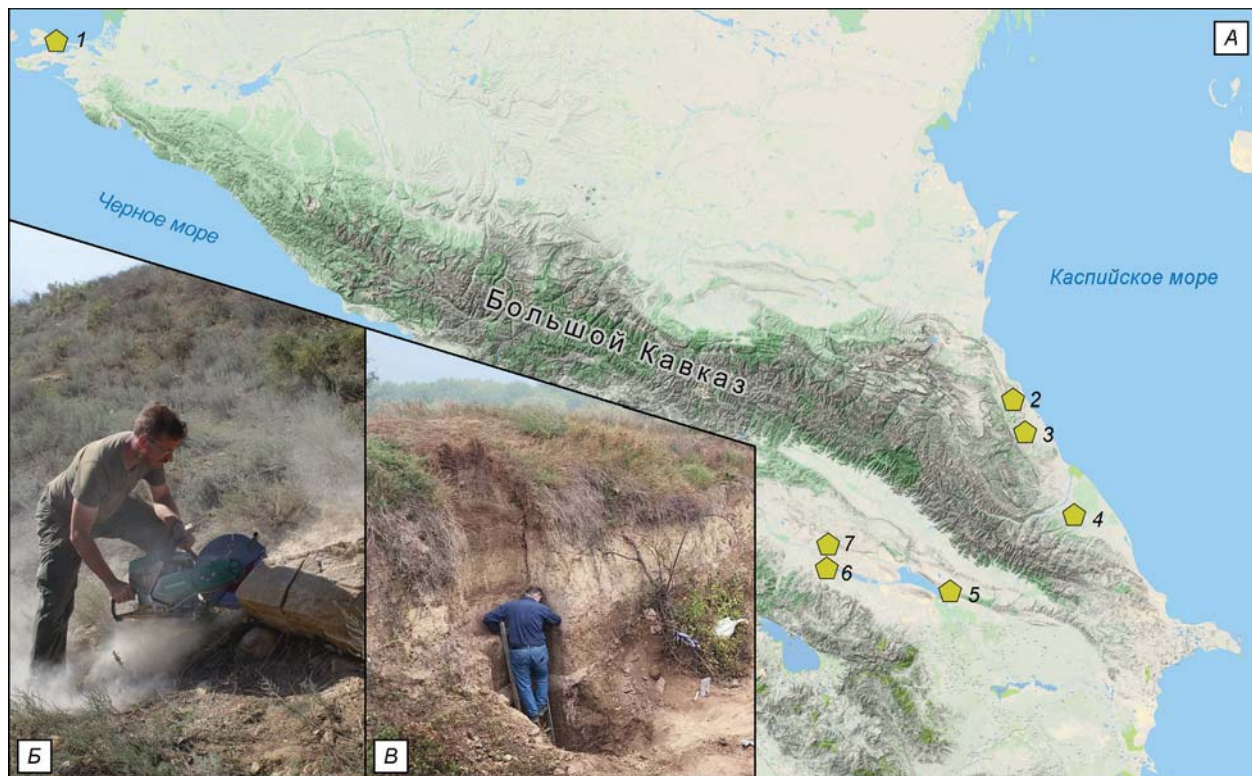
Рис. 1. Разведочные работы на территории Кавказа в 2023 г.: основные участки исследовательских работ (А), отбор образцов на Дарвагчае-1 (Б) и на Тините-1 (В).

1 – Таманский комплекс раннепалеолитических стоянок; 2 – Дарвагчайский комплекс палеолитических стоянок; 3 – Рубасский комплекс палеолитических стоянок; 4 – участок работ в нижнем течении р. Самур; 5 – участок работ в районе Мингячевирского водохранилища; 6, 7 – участки работ в среднем течении р. Куры.