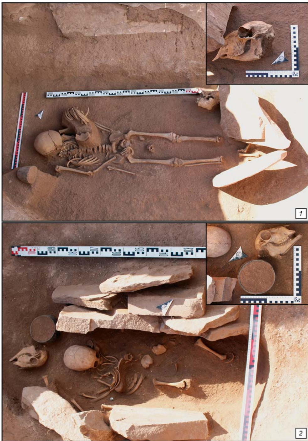
Рис. 2. Погребения с костями барана, обособленными от человеческих костяков.

1 – погр. 1, уровень 2; 2 – погр. 11, уровень 1.