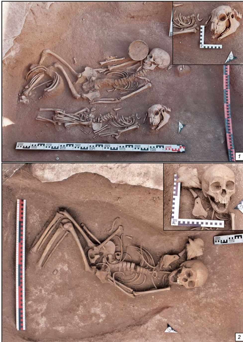
Рис. 3. Погребения с костями барана, расположенными вплотную к человеческим костякам.

С данной традицией связано заполнение 1 объекта 7, где, вероятно, была захоронена шкура овцы с черепом и костями ног (рис. 4).