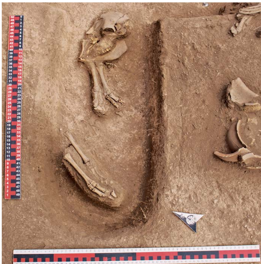
Рис. 4. Захоронение шкуры барана с костями ног и черепом в объекте 7.

Можно предположить, что погребенные помещались на (или под) шкуру овцы или барана, при этом череп выступал в качестве подушки, по аналогии с каменными плитками или «подушками» из органического материала [Савинов, 2009, с. 29].