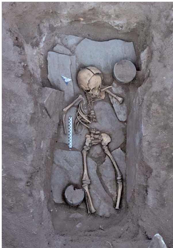
Рис. 4. Могильник Доможаков-6, кург. 9, мог. 2, детское погребение.

Могилы 7 располагалась над мог. 5. Представляет собой развалившийся каменный ящик, сооруженный из шести плит, размерами 1,2 \times 0,8 \times 0,3 м. Над восточной половиной ящика фиксировалась одна расщепившаяся плита каменного перекрытия. На дне