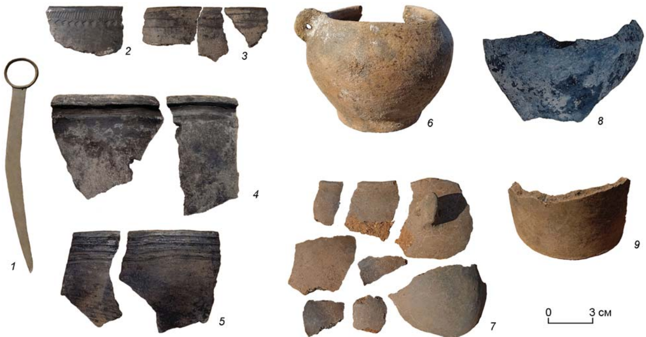
Рис. 3. Погребальный инвентарь кург. 9 и 10.

На уровне погребенной почвы расширено непогребенное каменное надмогильное сооружение размерами 1,6 × 0,9 м, сложенное из плитняка в 3–4 слоя. В нижней части перекрытия фиксировались две крупные плиты. Под плитами перекрытия выступали верхние края плит каменного ящика. За се-