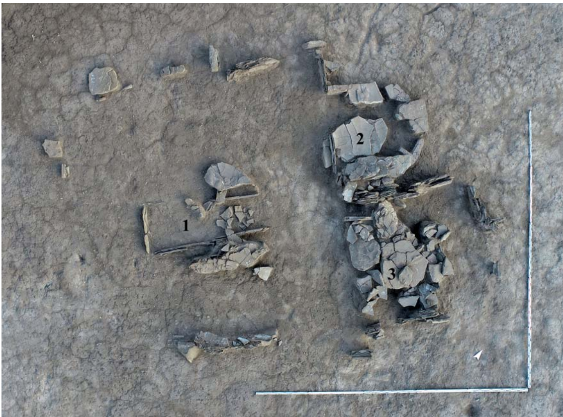
Рис. 5. Могильник Доможаков-6, кург. 10, конструкция ограды (вид сверху).

Могилы 3 исследована во второй пристроенной оградке. Внутри оградки фиксировались две крупные плиты, перекрывавшие могильную яму. Под плитами выявился трапециевидный каменный ящик размерами 1,1 \times 0,6 \times 0,4 \times 0,6 м. На дне и в заполнении – перемещенные грызунами разрозненные кости ребенка. У северо-восточной стенки – распавшийся на куски череп, смещенный со своего