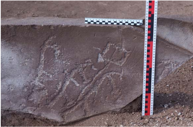
Рис. 2. Могильник Доможаков-6, кург. 9, рисунок на плите оградки.

четырем индивидам: трем взрослым и одному ребенку. Исследованная могила устроена во второй оградке. Вероятно, в процессе ее сооружения была полностью разрушена могила, располагавшаяся в центре ранней оградки. Поэтому часть найденных костей погребенных и предметов погребального инвентаря относится ко времени сооружения первой могилы.