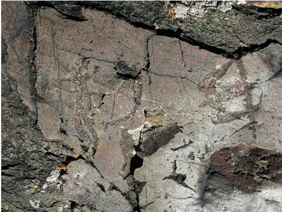
Рис. 1. Петроглифы Джурамала, Российский Алтай.