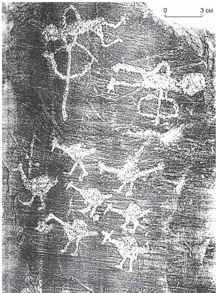
Рис. 3. Петроглифы Елангаша, Российский Алтай (эстампаж).

В семантических интерпретациях традиционно принимается во внимание, что птицы в архаической мифологии – один из доминантных образов, они участники