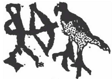
Рис. 2. Петроглифы гор Бэйшань, Китай. Без масштаба (по: [Zhou Xinghua, 1991]).

одна композиция из Чагана, выполненная в технике тонкой гравировки и относящаяся к древнетюркской эпохе, изображает хищных птиц, преследующих и нападающих на копытных. В сцене представлены разные птицы – одна с длинным, а две с короткими загнутыми клювами, с раздвоенным хвостом (рис. 5).