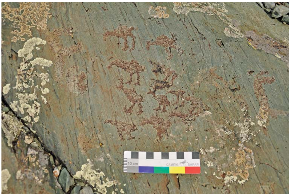
Рис. 4. Петроглифы Елангаша.