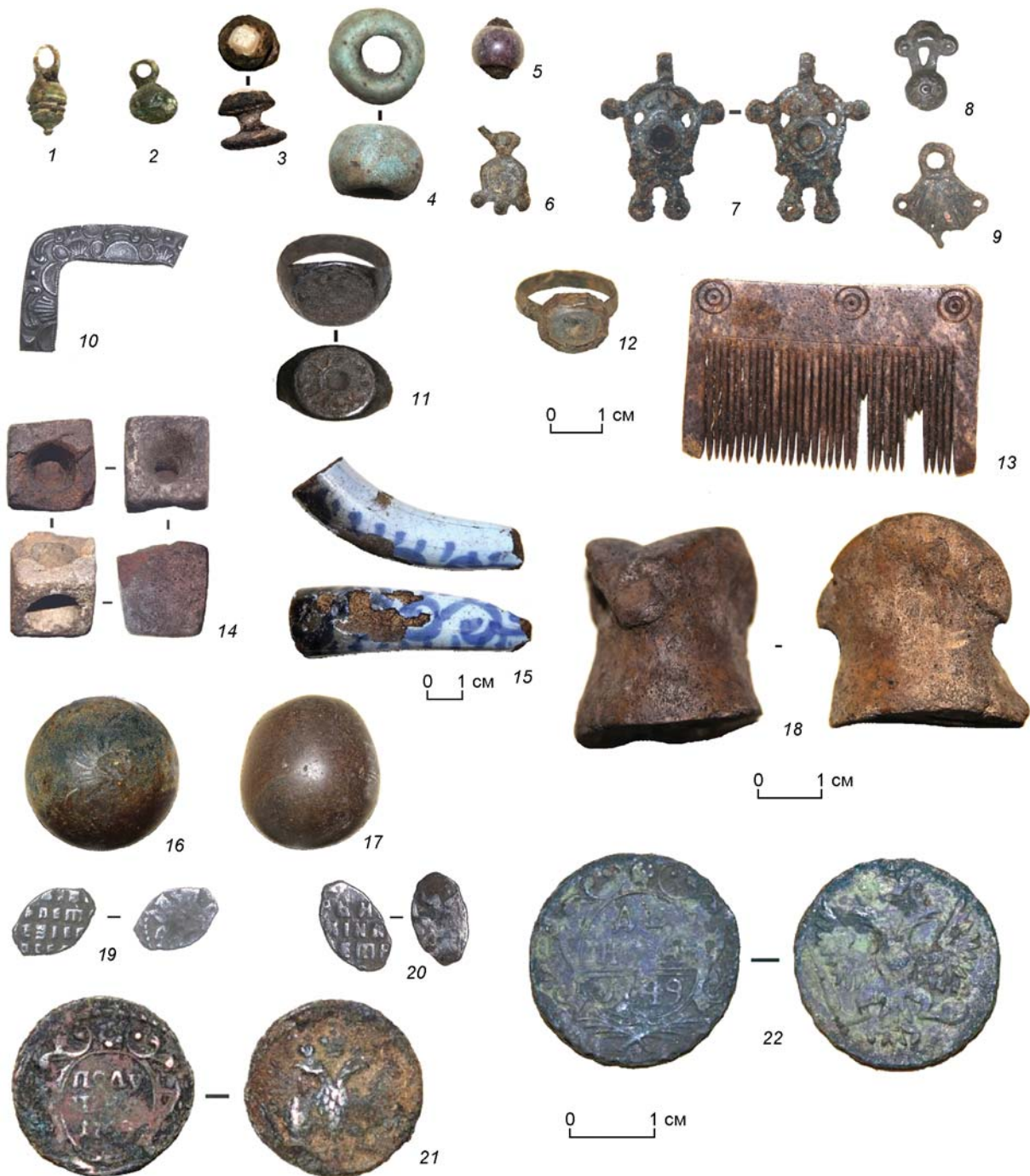
Рис. 3. Ананьино I. Предметы костюмных комплексов, трубки, игрушки, деньги.

1, 2 – гирьковидные металлические пуговицы; 3 – запонка с инкрустацией; 4 – голубая большая бусина; 5 – фрагмент сережки с бусиной; 6–9 – фрагменты украшений; 10 – часть серебряной портупейной пряжки; 11, 12 – перстни с орнаментированным и инкрустированным щитком; 13 – костяной гребень; 14 – глиняная головка курительной трубки; 15 – китайская фаянсовая курительная трубка; 16, 17 – стеклянные шары-игрушки; 18 – шахматная фигурка «слон» из кости; 19, 20 – монеты-чешуйки; 21 – монета-полушка 1739 г.; 22 – монета-денга 1749 г.