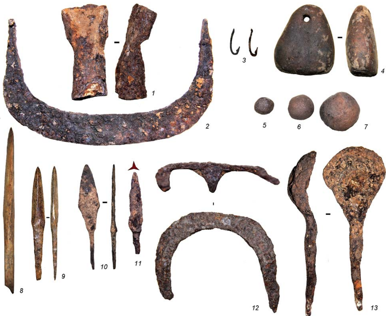
Рис. 2. Ананьино I. Орудийный комплекс, характеризующий элементы системы жизнеобеспечения.

1 – тесло (железо); 2 – скобель (железо); 3 – рыболовные крючковые снасти из железа; 4 – глиняное грузило; 5–7 – глиняные шарики для прачи; 8, 9 – костяные наконечники стрел; 10, 11 – железные наконечники стрел; 12 – железная подкова; 13 – железная ложка.