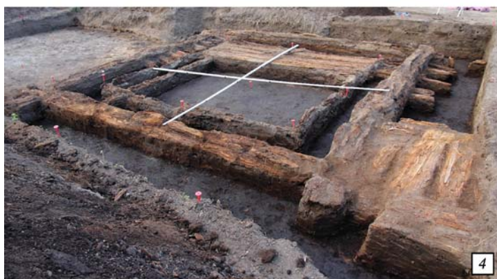
Рис. 1. Ананьино I. Раскопанная в 2022 г. одностопная изба.

1 – вид с СВ на наружный и внутренний срубы жилища на уровне третьего горизонта; 2 – вид СЗ части избы с развалом печи у наружной стены сруба; 3 – изба на уровне материковой поверхности, на переднем плане бревна-стулья под ЮВ стеной наружного сруба и половицы у СВ стены внутреннего сруба. Вид с В; 4 – изба на уровне материковой поверхности, на переднем плане крыльцо.