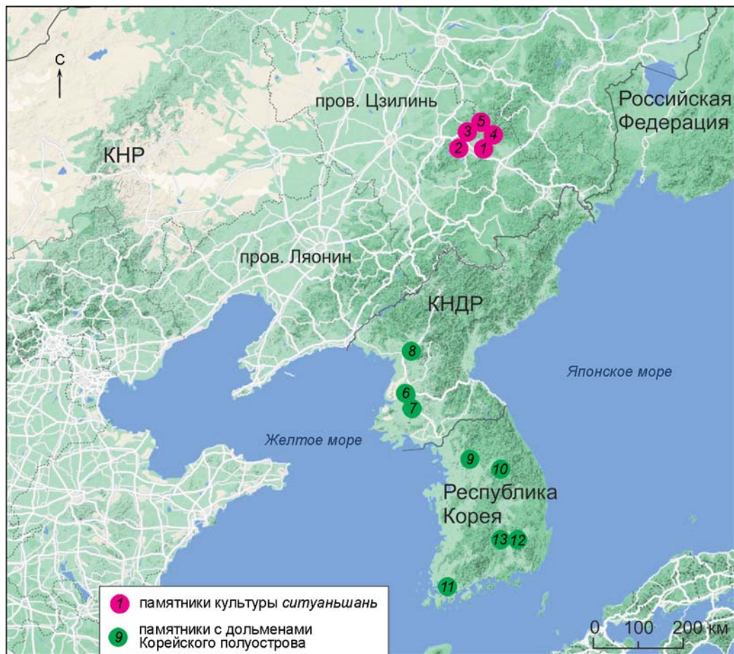
Рис. 1. Карта распространения памятников культуры ситуаньшань и дольменов Кореи.

1 – Ситуаньшань; 2 – Дунлинган; 3 – Хоушишань; 4 – Синсиншао; 5 – Чаншэхань; 6 – Симчхонни; 7 – Гвансондон; 8 – Мугбанни; 9 – Санджапхори; 10 – Хвансонни; 11 – Манбонни; 12 – Тэбондон-4; 13 – Понпхённи.