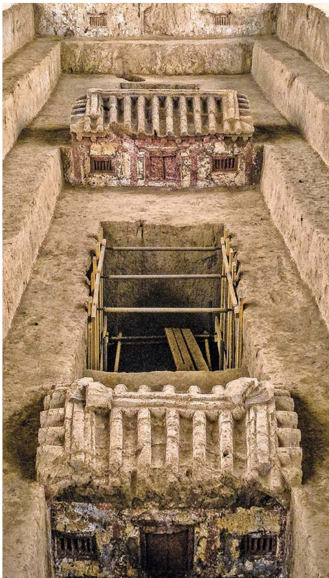
Рис. 2. Земляные модели построек в дромосе погр. М100 в Чжунчжаоцунь. По: [Ван Яньпэн, 2021, с. 80].

Именно погребальная пластика является наиболее информативным источником в составе погребальных комплексов Шестнадцати государств, заслуживающим отдельного подробного исследования. Расписанные красками фигурки во всех подробностях передают облик людей той эпохи, включая особенности прически и макияжа, одежды, головных уборов. Детально показаны упряжь и панцири боевых коней, устройство и убранство повозок. Весьма многочисленны и разнообразны фигурки, изображающие певцов и музыкантов, как правило, они составляют целые ансамбли.