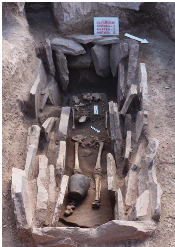
Рис. 2. Могильник Сагайская протока 2, курган № 2, могила 2, погребение (вид сверху).

Могилы 9 была устроена в могильной яме мог. 2, куда был впущен каменный ящик (размеры 1,2 \times 0,8 м). В заполнении ящика найдено два детских зуба, небольшой фрагмент кости животного и небольшой керамический сосуд баночной формы.