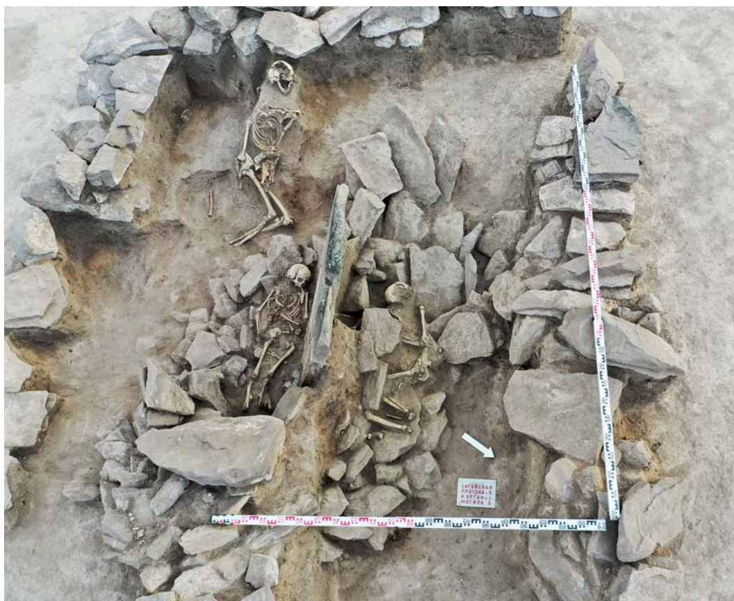
Рис. 4. Одиночный курган Сагайская протока 5, впускные погребения 1–3 (вид сверху, с северо-востока).

Могила 1 обнаружена в центральной части каменной кладки, из крупных плит которой была сооружена конструкция подпрямоугольной в плане формы (размеры 1,7 × 1,1 м). Ящик был заложён плитняком, среди которого встречались разрозненные костные останки скелета человека и животных. На глубине 0,6 м были обнаружены захоронения двух взрослых людей (рис. 4). Погребённый в могиле 1 был ориентирован головой на юго-запад. Дно могилы было не выровнено и, судя по положению скелета, можно считать, что человека поместили в могилу в полусидячем положении с подогнутыми ногами. Погребение 2 располагалось у основания каменной плиты, разделявшей мог. 1 и 3. Скелет находился в вытянутом положении на спине, черепом на запад. У левой берцовой кости зафиксирован сосуд баночной формы, под костями скелета — кости животных.