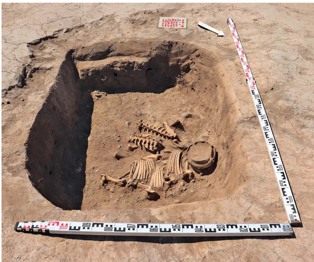
Рис. 5. Могильник Сагайская протока 8, курган № 1, объект 16 (вид с северо-востока).

На площади курганов № 6 (могильник Сагайская протока 2) и курганов № 1 и № 2 (могильник Сагайская протока 8) были зафиксированы объекты, которые можно отнести к культовым. До начала земляных работ курган № 6 представлял собой оплывшую земляную насыпь овальной в плане формы с несколькими горизонтально расположенными на ее поверхности плитами. Он вплотную примыкал к насыпи тагарского кургана № 7 и по результатам разведочных работ был отнесен к памятникам раннего железного века. Однако древней каменной конструкции на месте кургана 6 не зафиксировано. После снятия задернованного и гумусного слоя было выявлено 8 отдельных камней и плит,