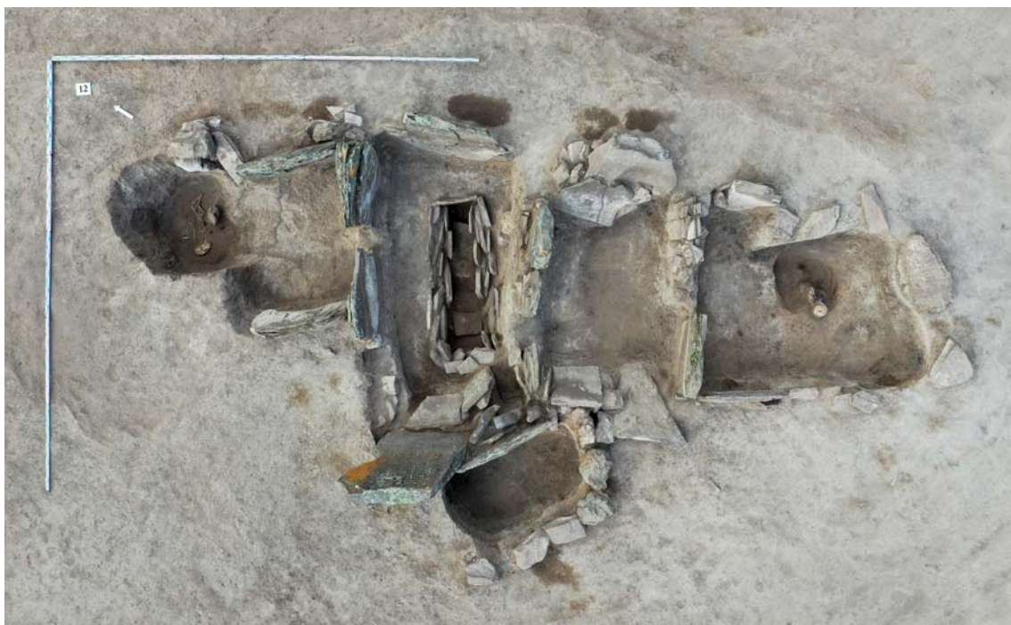
Рис. 1. Могильник Сагайская протока 2, курган № 2, каменные конструкции могил (вид сверху).

Могила 3 примыкала к мог. 2 с восточной стороны и представляла собой каменный ящик прямоугольной в плане формы из вертикально установленных плит песчаника (размеры 2,4 × 1,5 м), ориентированный длинной стороной по направлению северо-восток – юго-запад. В процессе расчистки каменного заполнения было зафиксировано впускное погребение ( мог. 10 ). Ниже него, на глубине 0,7 м были обнаружены костные останки взрослого человека. Сохранность скелета плохая. Предположительно, умерший был уложен на спи-