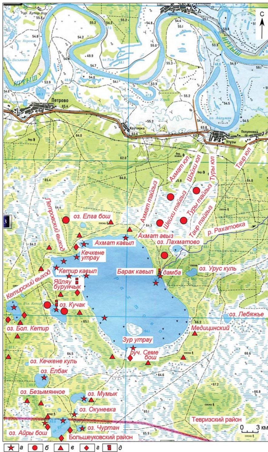
Рис. 2. Рисунок оз. Рахтово и его окрестностей.

а – места рыболовства; б – места сбора ягод; в – места произрастания сосны сибирской кедровой и сбора шишек; г – места охоты; д – промысловые избушки.