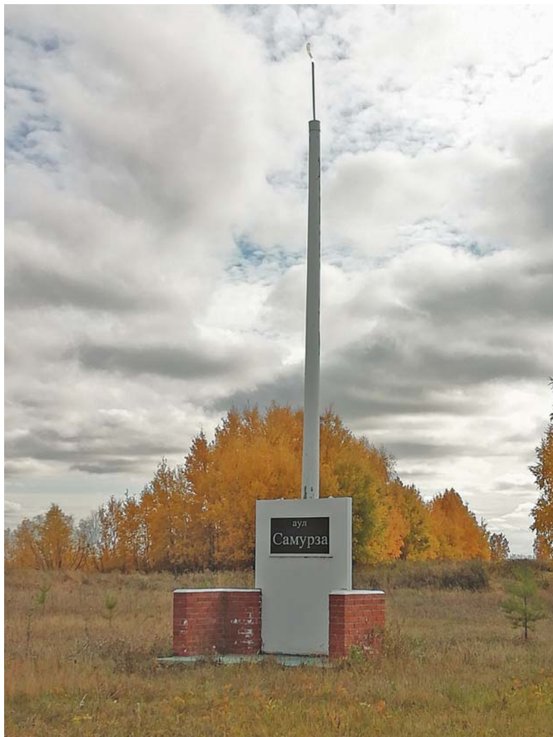
Рис. 2. Памятник исчезнувшему аулу Самурза в Русско-Полянском р-не Омской обл. (Фото И.В. Толпеко, 2021 г.).

По нашим сведениям первый памятник был сооружен в память об ауле Кожан-Бекен в 2001 г. в Таврическом р-не [Ахметова, Толпеко, 2013б, с. 396, рис. 1]. Инициаторами стали М.Е. Аятов, М.З. Буланов и К.К. Хусаинов. Фактически этих людей можно считать родоначальниками новой традиции, зародившейся в начале XXI в. у казахского населения Омской области. На сегодняшний день в Таврическом р-не известно 13 подобных объектов. В расположенных к западу от него Азовском немецком национальном и Шербакульском р-нах количество памятников также велико, соответственно 10 и 17. Много объектов было выявлено в находящихся к югу от этих районов Одесском (7) и к северо-западу – Москаленском (8) и Исилькульском (7). Единичные памятники зафиксированы нами в Павлоградском (3), Омском (1), Марьяновском (1) и Нововаршавском (2) р-нах.