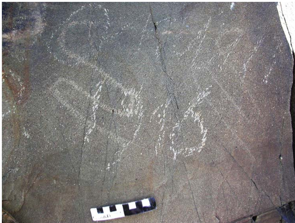
Рис. 3. Семиречье, Тамгалы. Две тамги в форме змеи.