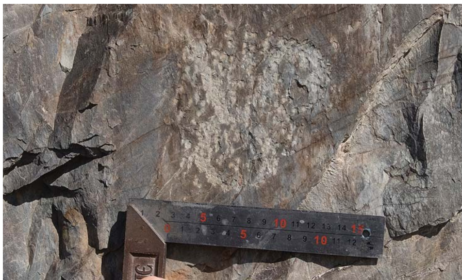
Рис. 4. Алтай, урочище Уле. Плоскость 3. Петроглиф-тамга.

Вполне очевидно, что изображения выполнены рукой не одного мастера, однако из-за сплошного подновления рисунков крайне сложно установить последовательность создания композиции.