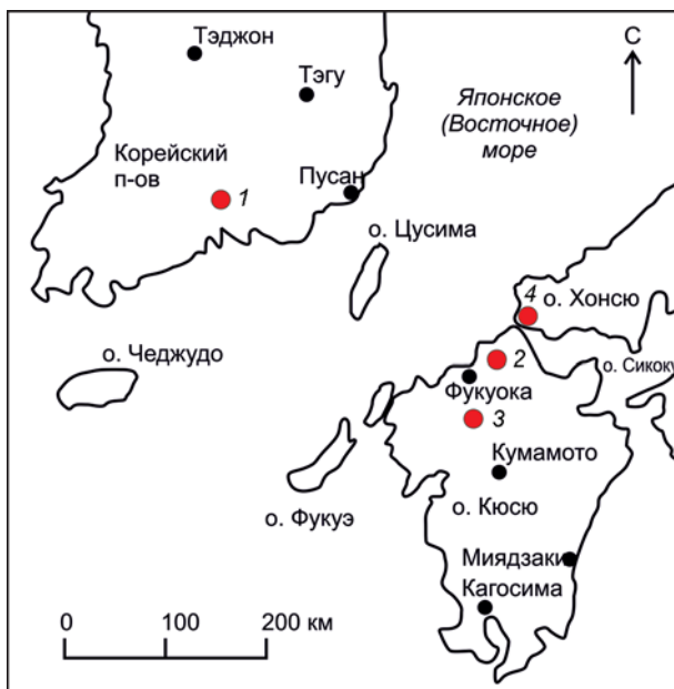
Рис. 1. Карта с обозначением памятников с погребениями в каменных ящиках Кореи и Японии эпохи раннего металла.

Особый интерес представляют обнаруженные на памятнике Тэпхённи погребальные комплексы. Дело в том, что здесь изучены не только погребальные конструкции и инвентарь, но также выявлены и достаточно редкие для Корейского полуострова антропологические материалы, позволяющие расширить представление о погребальных традициях населения бронзового века Кореи.