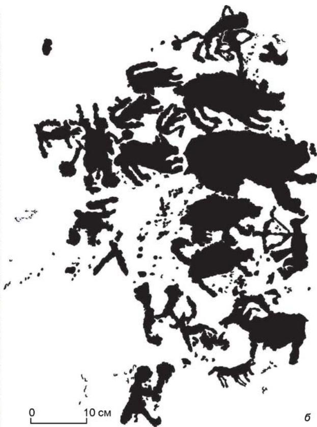
Рис. 1. Многофигурная композиция, пункт Саби-Салаа (северо-западная Монголия). Охота на медведя: а – фото авторов, б – прорисовка авторов.

Небольшого медведя лицом к лицу встречает еще один лучник. Ноги его выглядят не вполне доработанными (либо охотник стреляет с колен). На голове лучника отчетливо показан плюмаж. К туловищу примыкает подтреугольный предмет (возможно колчан). Наиболее реалистично передан натянутый лук со стрелой, направленный в зверя.