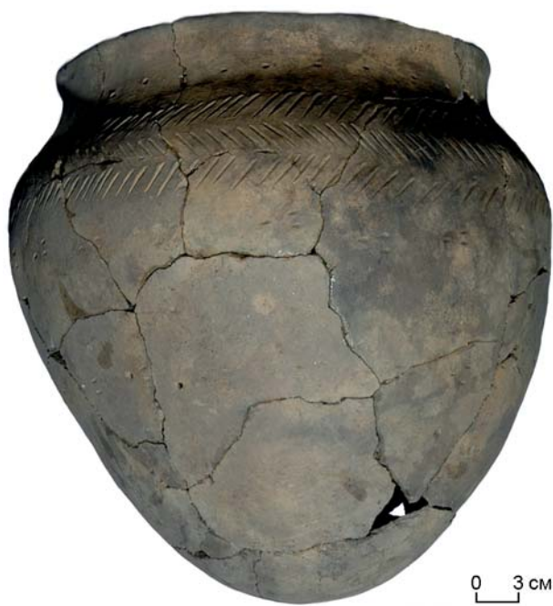
Рис. 1. Курганный могильник Могильно-Старожильск V, находки. Керамический сосуд из об. 2 кург. 41.

Подвеска из кург. 1, выполненная из оловянисто-свинцового сплава в форме шестилепесткового цветка, имеет диаметр 1,5–1,6 и толщину 0,2 см