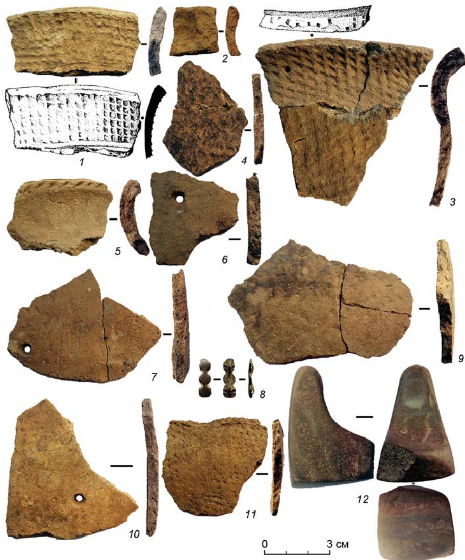
Рис. 2. Фрагменты керамики (1–7, 9, 11), бронзовая бляшка (8) и ложило (12) из слоя I памятника Усть-Ульма III. 1–3 – венчики, 4, 11 – стенки сосудов урийской культуры; 5 – венчик, 6, 7, 9, 10 – стенки сосудов талаканской культуры. Фото С.П. Нестерова, рисунки В.М. Калитенкова.

шек-полусфер [История Сибири, 2019, т. 2, с. 140, рис. 53, 25–27].