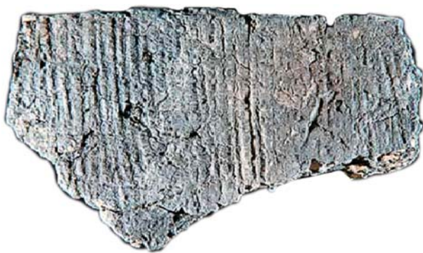
Рис. 1. Керамика осиповской культуры начального неолита Нижнего Приамурья с поселения Гася (по: [Медведев, 2017, с. 50]).

Керамика осиповской культуры раннего периода рыхлая, состав формовочной массы характеризуется наличием искусственных примесей – дресвы, песка, шамота, растительных волокон, а также длительным низкотемпературным обжигом (от 350 до 550°C) [Медведев, 2017]. При петрографическом анализе не были выделены какие-либо закономерности составления формовочной массы – примеси могли использоваться как отдельно, так и в сочетании двух-трех компонентов одновременно. В рецептах формовочной массы доминировали равнинные, реже «горные» илы, редко – сочетание двух групп илов. Часто характерно добавление органического раствора (в 60 % случаев) [Медведев, Цетлин, 2017, с. 169]. Встречаются в тесте довольно крупные включения разнородного минерального отощителя, фиксируемые на поверхности даже без использования микроскопа, в некоторых случаях до 1 см. О применении в качестве отощителя травы свидетельствуют характерные пустоты. Цветность черепка: с внешней стороны – серовато-коричневая, иногда розовато-коричневая или коричневая, внутри – серая, в изломе – серого или черного цветов [Медведев, Цетлин, 2013, с. 95]. Толщина стенок в среднем 0,8–1 см, сосуды меньшего размера имеют более тонкие стенки, большие сосуды массивные и толстостенные. Формование полого тела, вероятно, происходило двумя способами: с исполь-