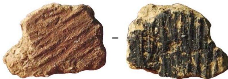
Рис. 3. Ранняя керамика с памятника Сяонаньшань в Китае (по: [Дунбэй я...]).

В данном контексте интересно и другое сравнение – с материалами стоянки Ямихта, вероятно, позднелокального варианта осиповской культуры, расположенной в окрестностях поселения Кондон-Почта, где исследователями отмечена керамика с двумя морфологически разными традициями. Ямихтинская керамика демонстрирует необычную рецептуру формовочных масс, а именно – использование растительных волокон и дробленой раковины примерно в одинаковых пропорциях. Эти примеси фиксируются на поверхности в виде характерных пустот. Типична также орнаментация характерными желобками, но как будто заглаженными после их нанесения. Венчик орнаментировался тоже в типичной для осиповской культуры манере – рассеченными узкими вдавлениями, встречаются сквозные отверстия. Ямихтинская керамика была датирована по нагару и укладывается в диапазон от 9 240 по 7 210 гг. до н.э., что несколько позже бытовавшей осиповской традиции, но все же хронологически затрагивает ее [Яншина, 2014, с. 150]. Наиболее архаичные ямихтинские вещи были синхронны осиповским. Они, скорее всего, представляют собой их поздний локальный вариант. Характерная черта – сочетание дробленой раковины и растительных волокон – также свойственна для некоторых вещей из Сяонаньшань [Ли Юцянь...], что тоже может свидетельствовать о большой цир-