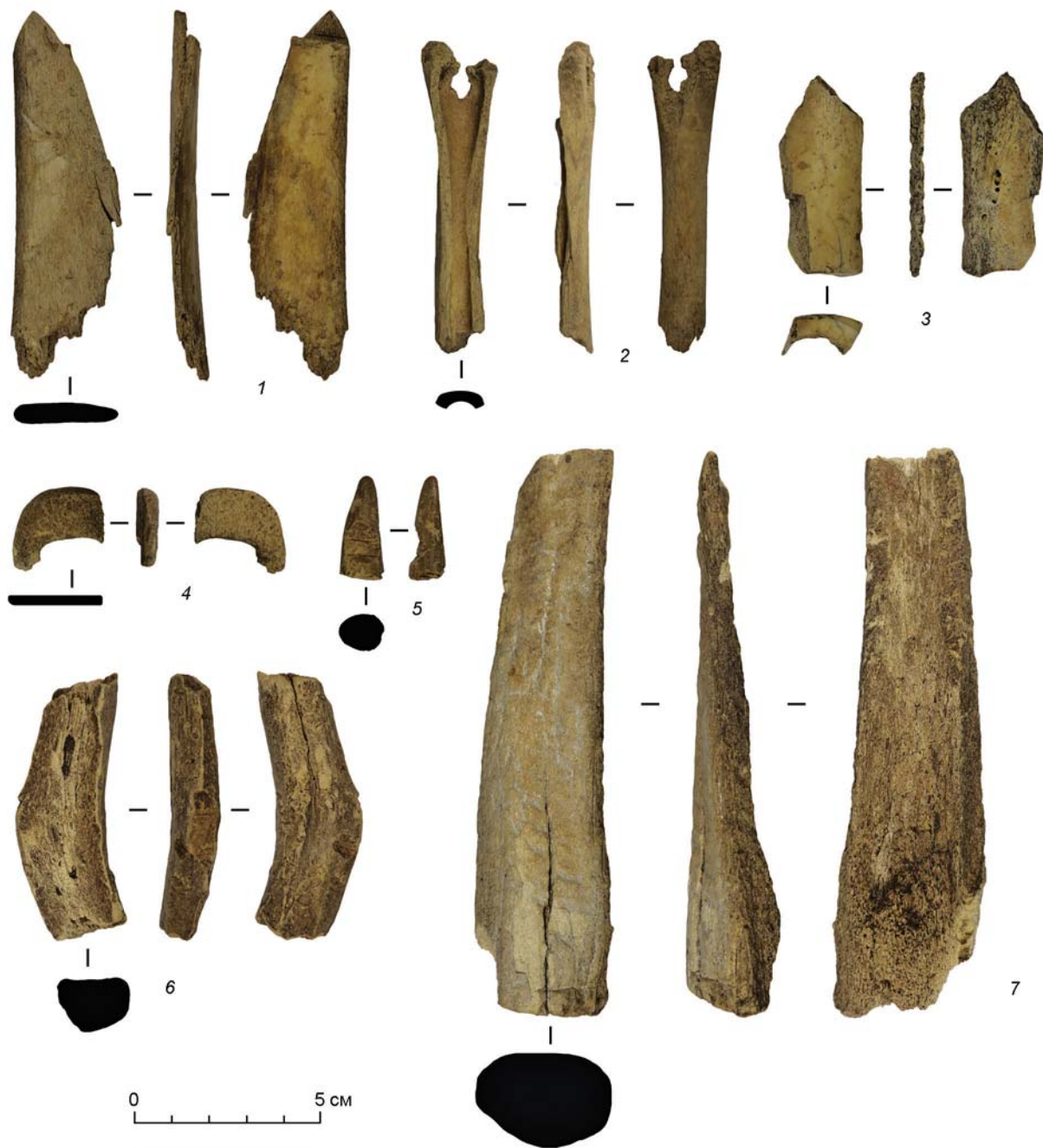
Рис. 2. Казановка-10. Изделия из кости и рога.

1 – ложило (?); 2 – фрагмент мочеотводной трубки (?); 3, 6, 7 – пластины; 4 – фрагмент пряжки; 5 – цурка-застежка (?). 1–3 – кость; 4–7 – рог.