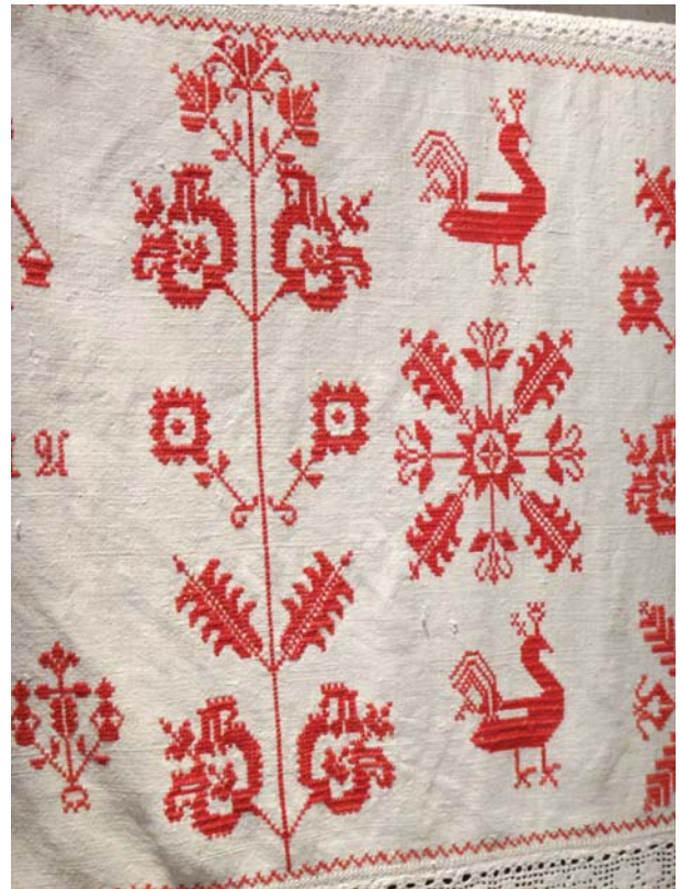
Рис. 5. Фрагмент скатерти из коллекции Этнографического музея, г. Брашов (Румыния).

Материалы вышивок двойного креста, из которого исчезли растительные узоры, свидетельствуют о том, что с упрочением христианства крестообразные мотивы были переосмыслены и стали