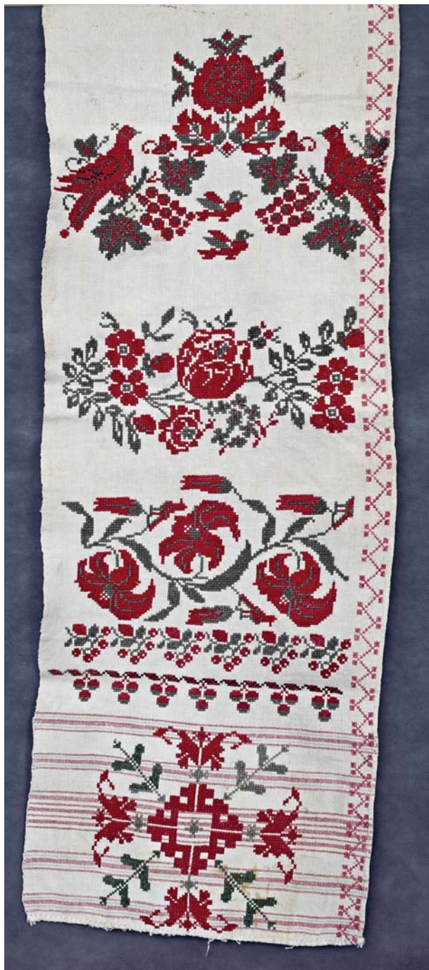
Рис. 2. Конец льняного полотенца, д. Чумаково Куйбышевского р-на Новосибирской обл., начало XX в.

А.Л. Топоркова, глубинная семантика предметных символов определяется их медиативной функцией, т.е. переходом из своего мира в чужой или от живых к мертвым [1989, с. 94], что, вероятно, и имеет отношение к данному конкретному случаю.