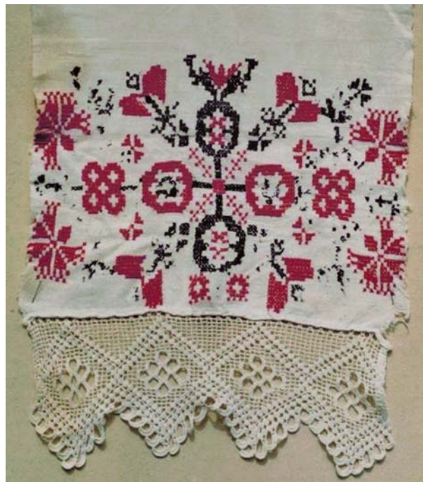
Рис. 1. Конец льняного полотенца. Старообрядцы-кержаки д. Тайна Красноярского р-на Алтайского края, конец XIX в.

Полевые материалы позволяют обозначить достаточно широкую территорию бытования типов графики «проросших крестов» в Западной Сибири: Северный Алтай, Причумышье, Барабинская лесостепь, Васюганье (Васюганская равнина в пределах Новосибирской области). В богато орнаментированном полотенец из д. Чумаково Куйбышевского р-на Новосибирской обл. (ранее относилось к Каинскому у. Томской губ., ПМА