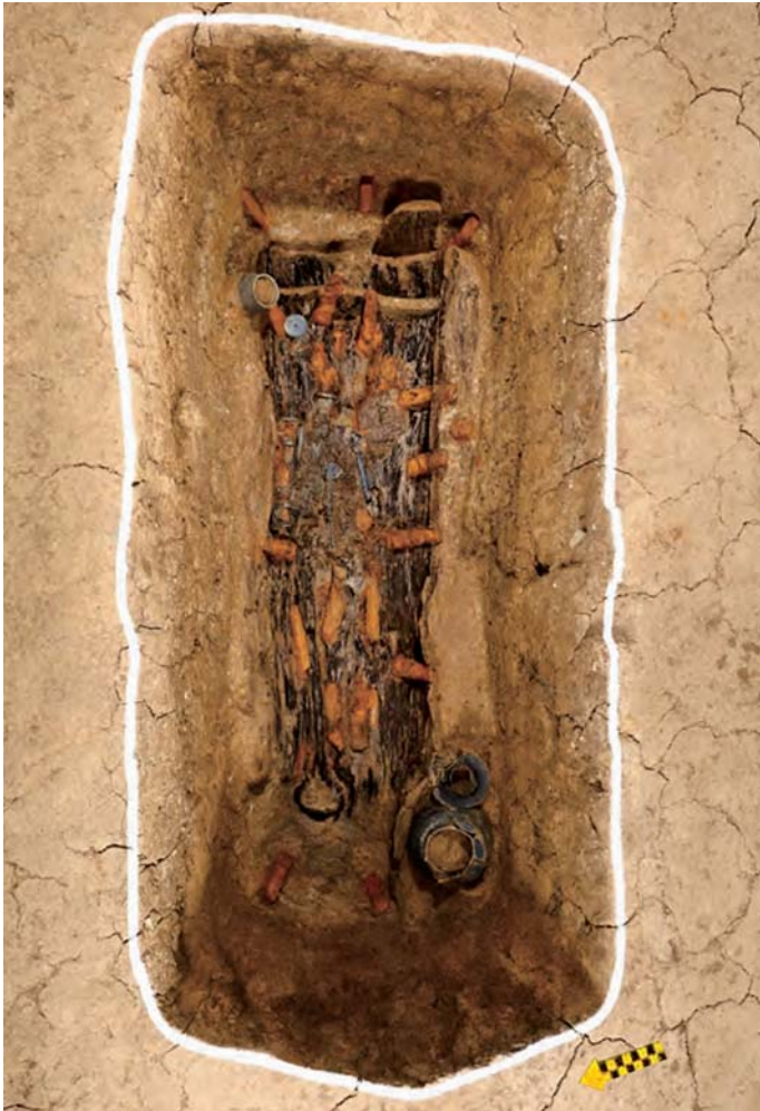
Рис. 2. Общий вид на погребение № 1 Йанджири (по: [Чхве Дэён, 2017, с. 55]).

ориентированной продольной осью по линии запад – восток. Размеры ямы 2,96 × 1,44 м, глубина 0,49 м. По находкам бусин и фрагментов шейной гривны в восточной части могильной ямы предполагается, что тело умершего лежало головой на восток. В центральной части могильной ямы сооружен яокэн округлой в плане формы, диаметром 0,8–0,9 м.