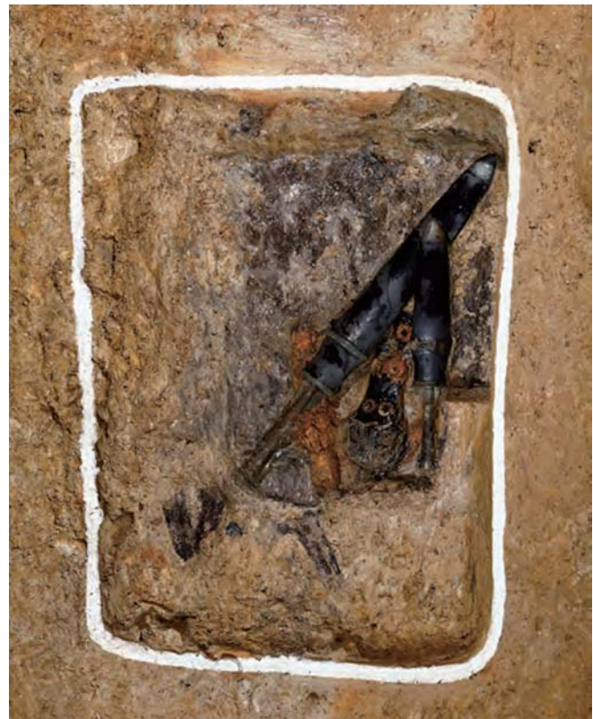
Рис. 3. Яокэн в погребении № 1 Йанджири (по: [Чхве Дэён, 2017, с. 58]).

Наибольшим богатством и разнообразием отличается погребальный инвентарь, помещенный в деревянный гроб вместе с телом умершего. Здесь обнаружен бронзовый кинжал с навершием, вложенный в лаковые ножны, железный кинжал в ла-