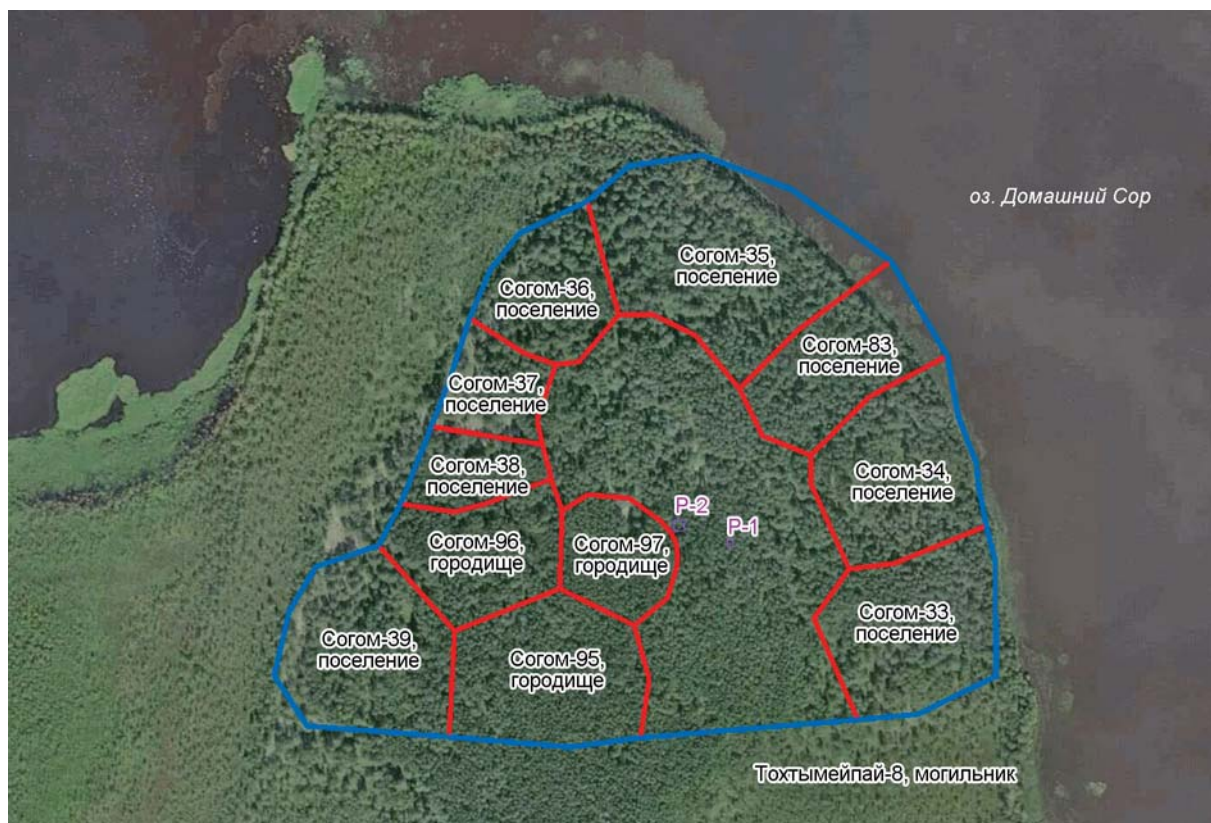
Рис. 2. Карта-схема (космоснимок) расположения границ могильника Тохтымейпай-8.

В полевой сезон 2017 г. в центральной части территории памятника было заложено 2 раскопа общей площадью 69 м 2 (20 и 49 м 2 ), полностью изучено 12 погребений (см. таблицу ), а также зафиксирован объект, предварительно названный авторами поминальным местом.