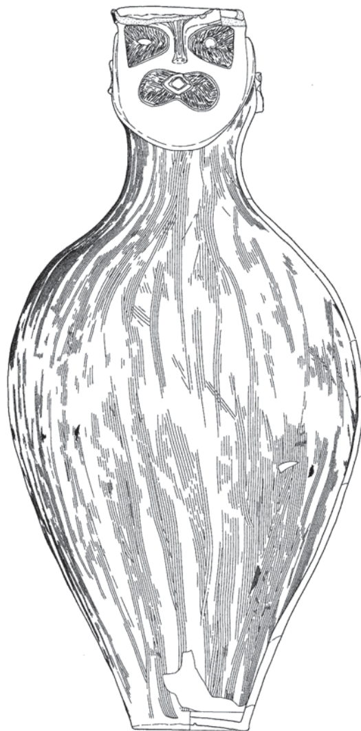
Рис. 3. Погребение в сосуде с человеческим лицом из Идзумисакаситы.

Большое влияние на представления ученых о вторичных погребениях периода яёй оказало максимально детальное изучение материалов памятника раннего этапа этого периода Оки II, преф. Гумма. Группой археологов были исследованы погребальные конструкции, кости, зубы, что позволило восстановить последовательность дей-