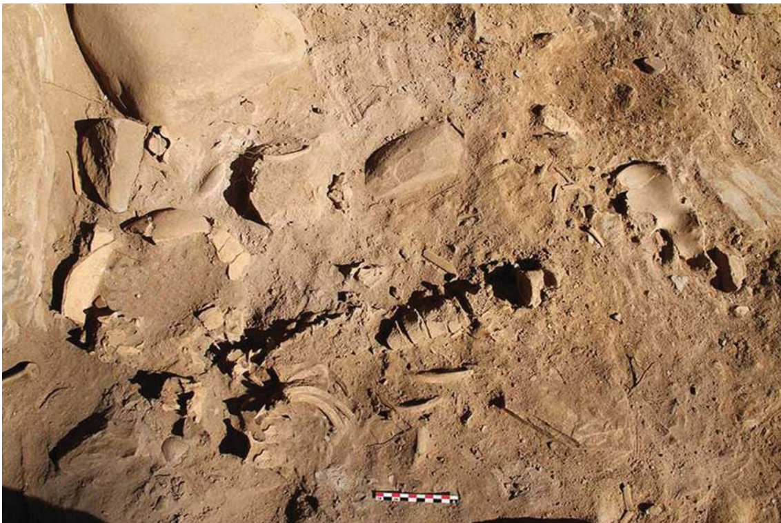
Рис. 2. Погребение № 1 в пещере Мэдун, Республика Корея (по: [Юн Тхэджон, 2017]).

Захоронение в пещере Мэдун (д. Нагдонни в у. Чонсон пров. Канвондо) обнаружено в ходе раскопок, проводившихся в 2017 г. сотрудниками Музея университета Йонсе. В границах раскопа, заложенного возле входа в пещеру, зафиксирован слой мощностью до 0,18 м, датирующийся бронзовым веком. В толще данного слоя выявлены останки четырех индивидуумов и погребальный инвентарь: шлифованный каменный наконечник стрелы, фрагменты керамических сосудов. Погребения № 1 и 2 приурочены к кровле этого слоя. Оба захоронения совершены на полу пещеры, по периметру выложены обломками камня. Погребение № 1 со-