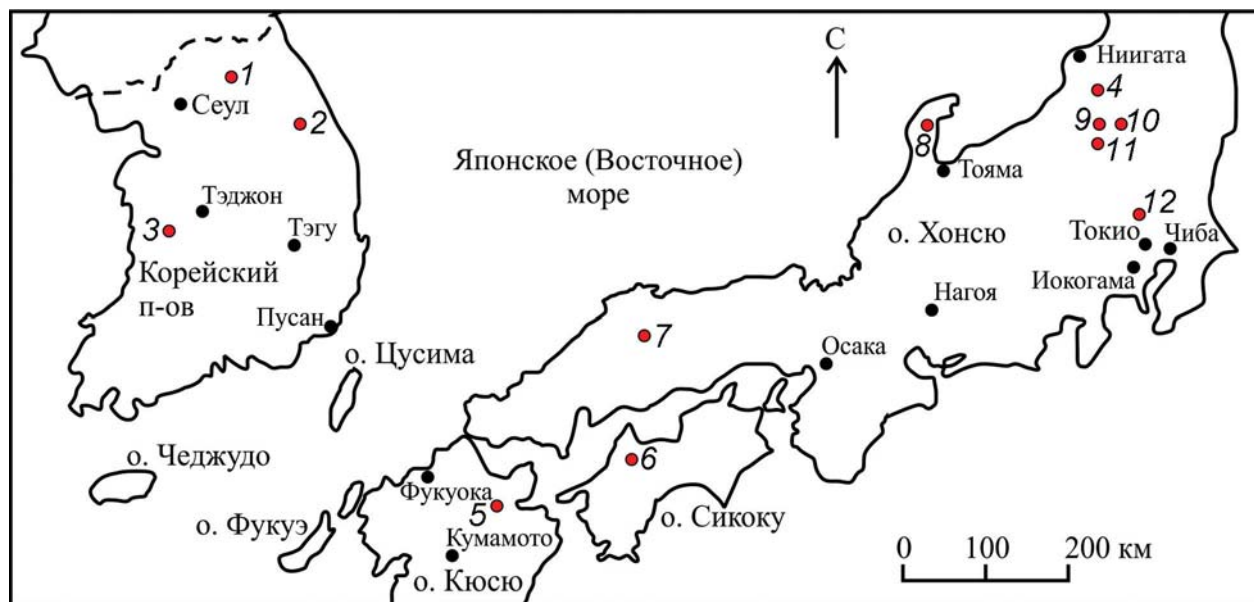
Рис. 1. Карта с обозначением погребений в пещерах на территории юга Кореи и Японии.

На территории Корейского п-ова известно по одному пещерному погребению эпохи неолита и бронзы (рис. 1, 1, 2). Погребение в пещере Кёдон в квартале Хупхёндон г. Чхунчхон в пров. Канвондо обнаружено в 1963 г. в ходе проведения работ по строительству корпусов женского университета