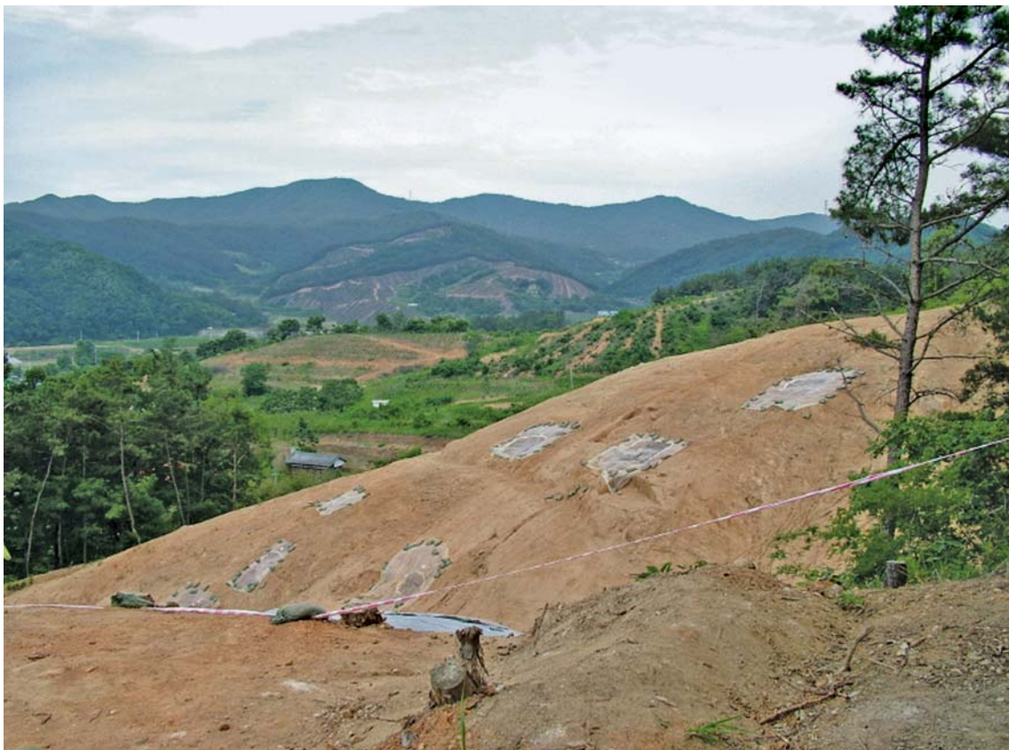
Рис. 3. Погребения в горизонтальных нишах на памятнике Танджири, Республика Корея (по: [Ким Нагджун, 2019, с. 273]).

держало череп, позвоночник, ребра и тазовые кости. Голова погребенного уложена по направлению к входу в пещеру (рис. 2). В погребении № 2 обнаружен только череп. Содержащий захоронения слой включает большое количество пепла. Представляется вероятным, что до совершения захоронения на полу пещеры разводили костер, предположительно с целью совершения ритуально-поминальных действий. Останки еще двух погребенных (один – ребенок) обнаружены в разрозненном состоянии в подошве слоя бронзового века. По результатам естественно-научного датирования материалы вмещающего погребения слоя бронзового века отнесены к XII–VIII вв. до н.э. [Юн Тхэджон, 2017].