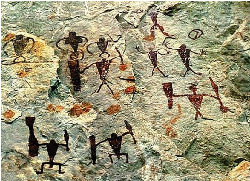
Рис. 1. Цаньюаньская пирриха (название условное).

манере, что позволяет объединять локусы в единый памятник. Его часто определяют по названию уезда как писаницы Цаньюань. В 1990–2000-х гг. там открыли еще пять локусов (и девять – в смежных волостях) с аналогичными наскальными рисунками, но они недостаточно известны; все исследования в основном опираются на материалы первой десятки [Ян Баокан, Ван Цзюнь, 2007, с. 59]. Изображения выполнены краской, созданной, как показал спектральный анализ, на основе местного гематита; рядом с писаницами сохранились ямы, где этот минерал добывали представители народа ва ,