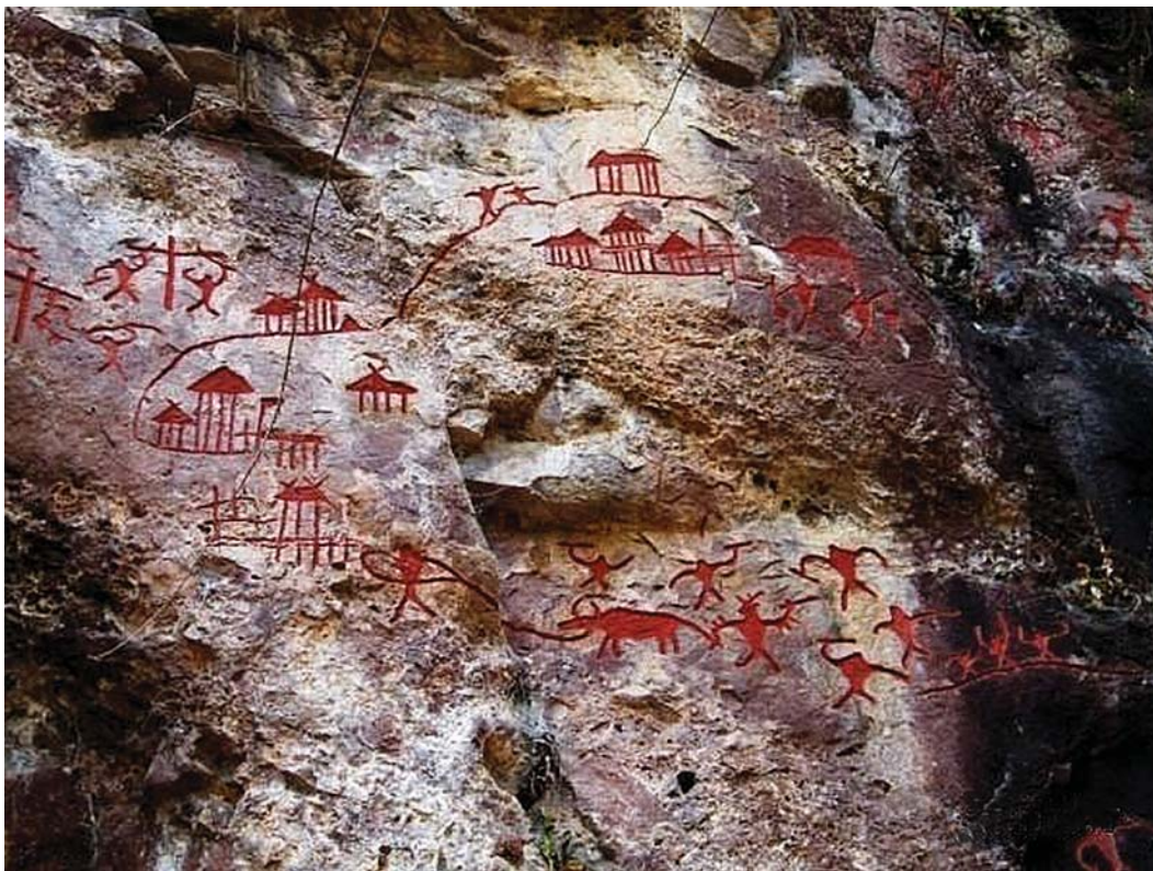
Рис. 3. Писаница Цангьюанья, «дома на сваях» (название условное).

чтобы приготовить краску для ритуальной росписи «больших домов» (резиденций вождей), в которой они следовали образцам ближайшей наскальной живописи [Wang Ningsheng, 1985, p. 25]. В качестве связующего вещества использовалась бычья кровь. Цвет рисунков в разных локусах варьирует от красно-алого до темно-коричневого (рис. 1–4); но связано ли это с составом краски, возрастом, особенностями места – не ясно. Рисовали на скальных плоскостях на высоте от 1 до 8 м от поверхности, в основном пальцами, но иногда использовали кисти из растительных материалов. Назовем примерные размеры фигур по вертикали (поскольку в доступных нам иллюстрациях масштаб не указан) – от 4 до 30 см, но параметры большинства – примерно 10 см.