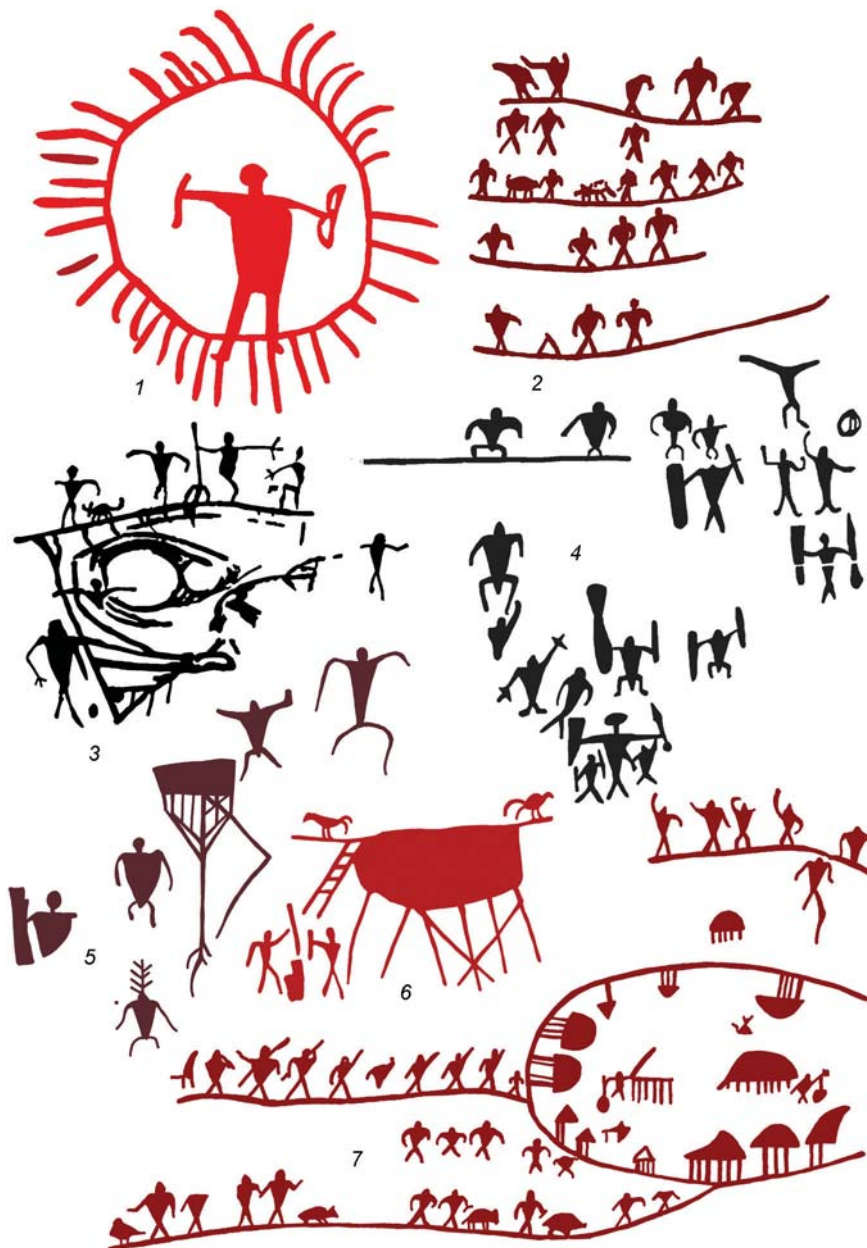
Рис. 5. Наскальная живопись разных локусов Цаньюанья. Коллаж подготовлен к печати А.И. Соловьевым по: [Wang Ningsheng, 1985; Чэнь Чжаофу, 2008]. Рисунки даны не в масштабе.

1 – «солнечный лучник», локус 7; 2 – «все пути ведут... – куда?», фрагмент рисунка, локус 2; 3 – «человек выбирается из пещеры», локус 6; 4 – «танцы со щитами» (?), локус 6; 5 – строители «гнезда», локус 5; 6 – «птицы на коньке крыши + размалывание зерна (?) в ступе», локус 5; 7 – «план поселения», локус 2.