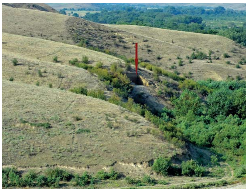
Рис. 1. Стоянка Дарвагчай-залив-4. Общий вид.

Среднепалеолитические артефакты, обнаруженные в горизонте палеопочвы (слой 1в) (рис. 2), име-