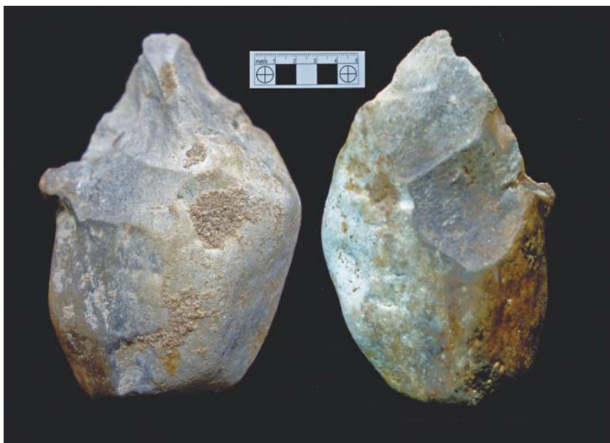
Рис. 5. Каменное орудие – пик со стоянки Дарвагчай-залив-4.