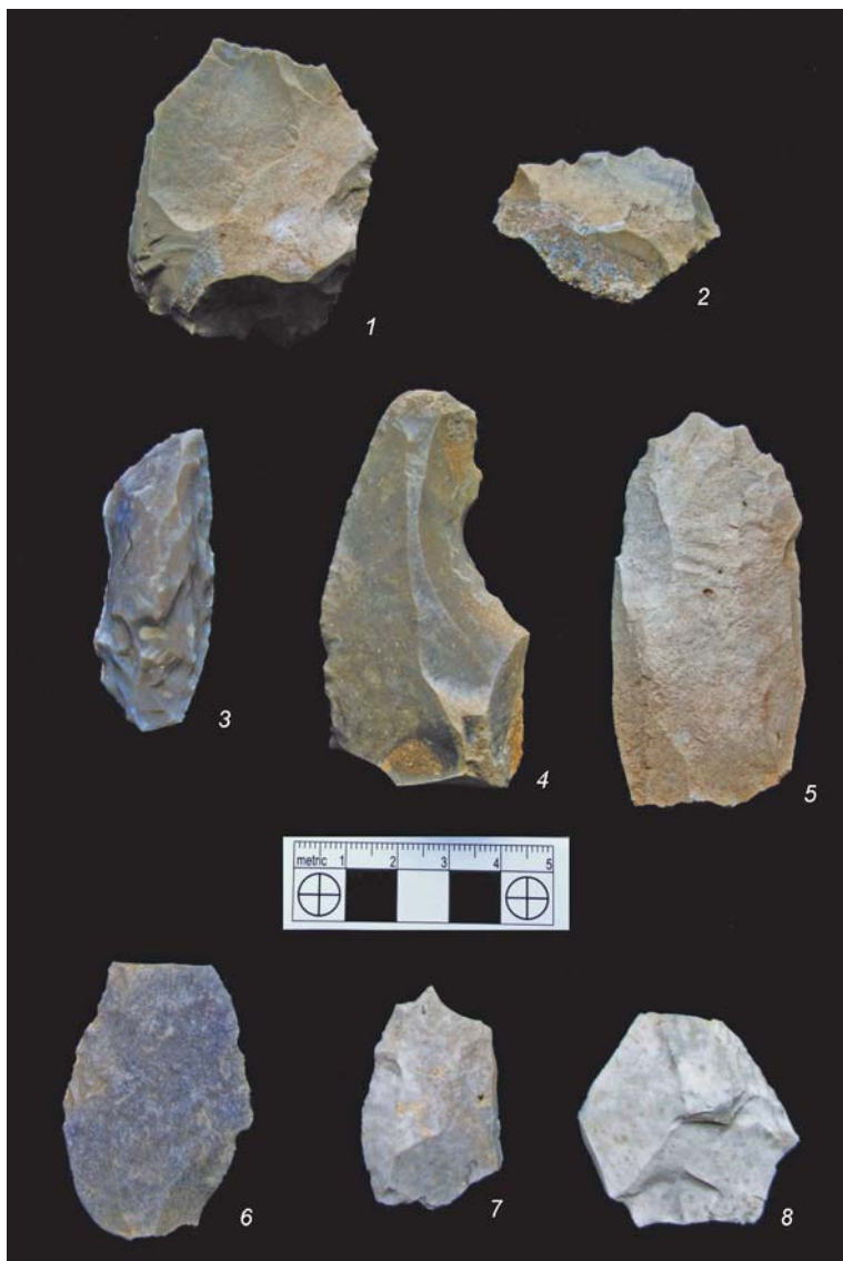
Рис. 3. Каменные артефакты стоянки Дарвагчай-залив-4.

Изделий со следами вторичной обработки 6 экз., кроме них в орудийный набор включены леваллуазские отщеп, пластина и отбойник. У леваллуазских сколов площадки выпуклые фасетированные. Отщеп средних размеров (рис. 3, 7) дистальная часть обломана, пластина крупная без следов оформления и утилизации (рис. 3, 5). Отбойник представлен плоской галькой округлой формы со следами забитости на продольном крае. Наиболее выразительные орудия в коллекции – это лимас и комбинированное изделие – оба выполнены из кремня. Лимас трапециевидной формы (6 × 2,4 × 2,3 см), в качестве заготовки использовался крупный массивный отщеп, лезвие по всему периметру оформлено разнофасеточной ступенчатой ретушью (см. рис. 1, 3). Заготовкой для комбинированного орудия послужила крупная пластина (8,7 × 4 × 1,1 см), на одном продольном крае видна четко выраженная ретушь утилизации, на другом расположена выемка, образованная крупной и средней ретушью (рис. 3, 4). Одно двойное продольно-поперечное скребло