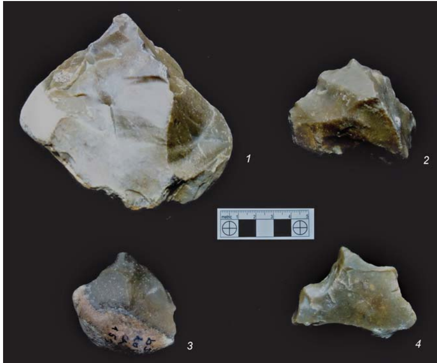
Рис. 4. Каменные артефакты стоянки Дарвагчай-залив-4. 1 – пик; 2–4 – шиповидные орудия.

Наиболее выразительными изделиями являются пики. В качестве заготовки в одном случае использовалась (15,5 × 10 × 8,1 см) массивная продолговатая галька. Основание орудия галечное, примерно половина плоскостей оформлена крупными и средними сколами, сечение двояко выпуклое, на хорошо выделенном трехгранном острие есть следы утилизации в виде мелких сколов (рис. 5). Два