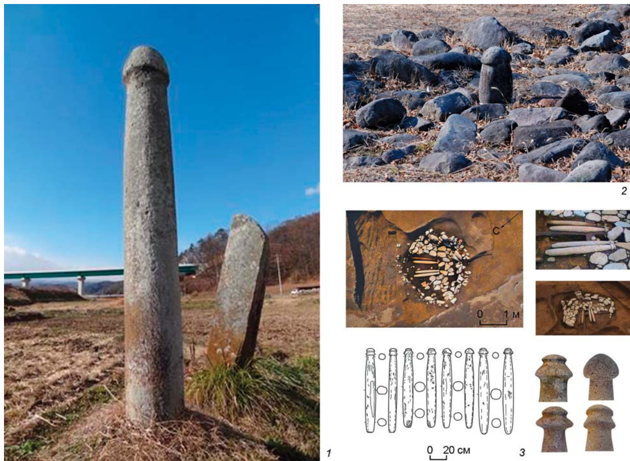
Рис. 3. Каменные жезлы сэкибо (по: [Танигути, 2015; Кинсэй исэки II, 1986; Симидзу, 2013]).

1 – большое сэкибо (Китадзава, преф. Нагано); 2 – сэкибо (памятник Кинсэй, преф. Яманаси); 3 – клад сэкибо (памятник Мидорикава Хигаси, столичный округ Токио).