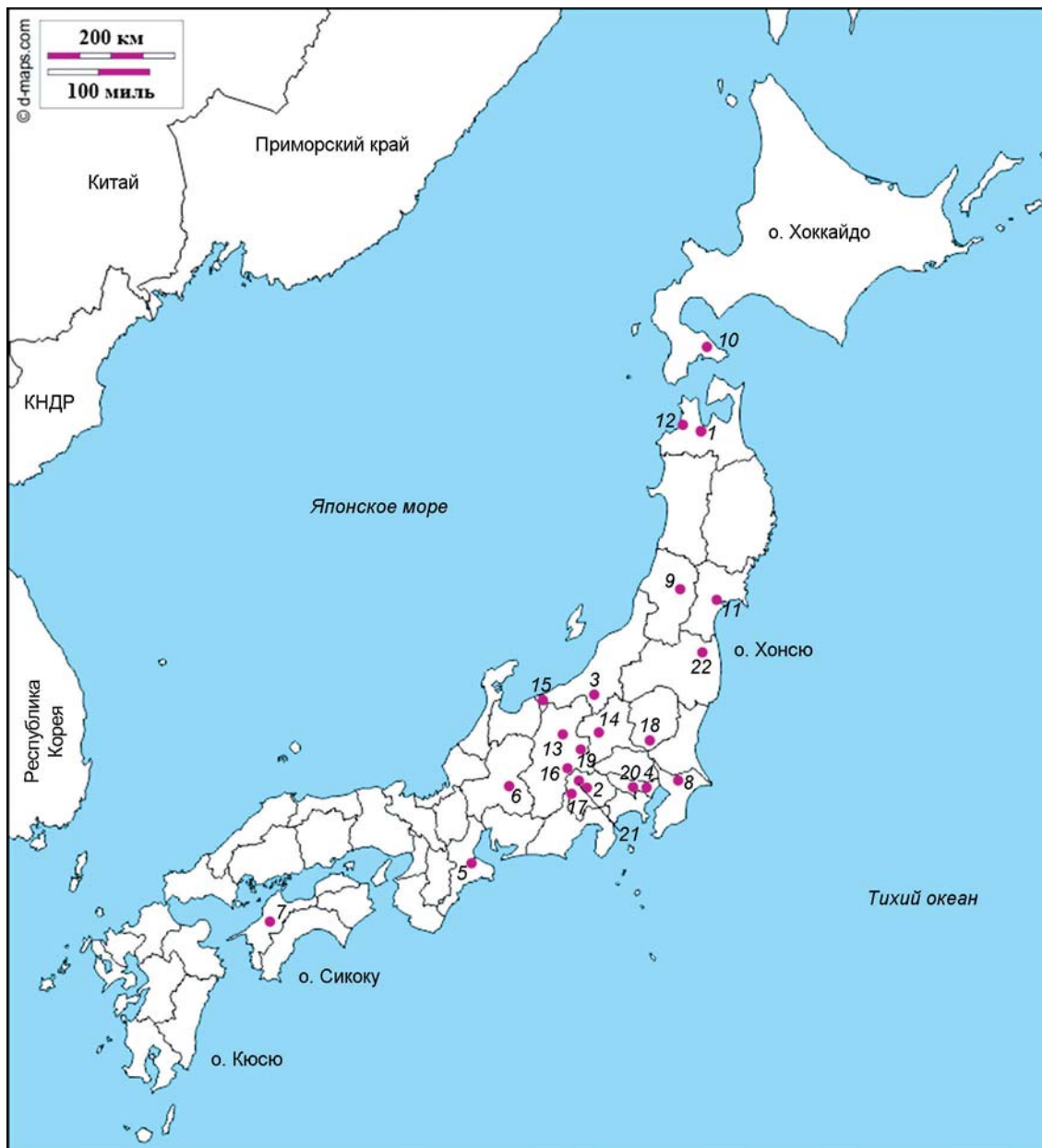
Рис. 1. Расположение памятников, упоминаемых в тексте.

1 – Саннай Маруяма (г. Аомори, преф. Аомори); 2 – Сякадо: (г. Кофу, преф. Яманаси); 3 – Додзиттэ (пос. Цунан, преф. Ниигата); 4 – Тадао район А1 (Токио); 5 – Каюми Идзири (г. Мацусака, преф. Миэ); 6 – Аидани Каманохара (г. Хигасиоми, преф. Сига); 7 – Камикуроива (пос. Кумакоген, преф. Эхиме); 8 – Кинонэ (пос. Сакаэ, преф. Тиба); 9 – Нисиномаэ (пос. Фунагата, преф. Ямагата); 10 – Тёбонаино (пос. Минамикаябэ, преф. Хоккайдо); 11 – Икода (г. Сендай, преф. Мияги); 12 – Камэгаока (г. Цугару, преф. Аомори); 13 – Накаппара (г. Тикума, преф. Нагано); 14 – Гобара (пос. Ивасима, преф. Гумма); 15 – Тёдзяхара (г. Итоигава, преф. Ниигата); 16 – Танабатакэ (г. Тино, преф. Нагано); 17 – Имодзия (г. Минамиарупусу, преф. Нагано); 18 – Симокубо (г. Тотиги, преф. Тотиги); 19 – Китадзава (пос. Сакухо, преф. Нагано); 20 – Мидорикава Хигаси (г. Кунитати, столичный округ Токио); 21 – Кинсэй (г. Кофу, преф. Яманаси); 22 – Уэнодай «А» (с. Иитате, преф. Фукусима).