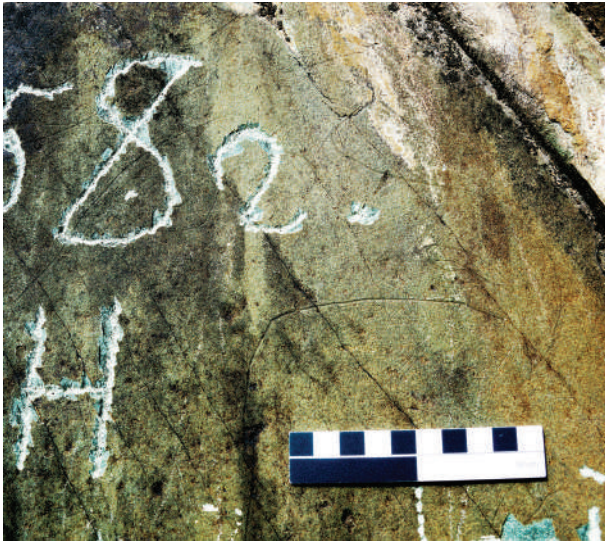
Рис. 2. Фото головы «олене-грифона» из Калбак-Таша I.

«Олене-грифоны» воспроизведены мной без налегающих на них раннесредневековых гравировок и рунических строк (см. рис. 1, 1). Длина фигур составляет примерно 64 см при высоте 40 см. Резные линии, которыми они выполнены, довольно широкие и глубокие, хотя и сильно патинизированные (см. рис. 2). Это особенно хорошо видно в сравнении с более светлыми и тонкими резами древнетюркской эпохи. Именно сильная патинизация, раннесредневековые изображения, рунические строки и огромная посетительская надпись («Юдин Василий Осипович») поверх фигур этих синкретических существ осложняют их восприятие и копирование. Тем не менее абрис верхнего мифического животного был воспроизведен В.Д. Кубаревым правильно [2011, с. 255], хотя, видимо, не будучи до конца уверенным в нем, исследователь не уделил ему внимания в отношении интерпретации, датировки и т.п. Ему не удалось рассмотреть детали изображения (завитки рогов, глаз, ухо, когти) и зафиксировать нижнюю фигуру.