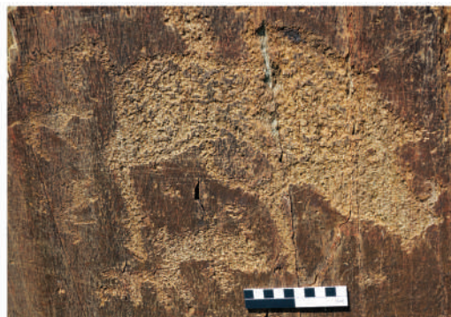
Рис. 3. Фрагмент композиции из Калбак-Таша I с кабаном, пораженным стрелами (1), и аналогии этого образа в петроглифах Калбак-Таша II (2, 3).

всю ее площадь занимает фигура животного, прозванного гидами «носорогом» (рис. 3, 1). Действительно, поначалу кажется, что морда животного заканчивается рогом. Однако в дальнейшем становится очевидным, что это большая фигура кабана ( Sus scrofa ). Длина гравировки 64 см, высота 46 см. Общий абрис фигуры кабана весьма изящен, у него показаны две ноги – он как будто стоит на «цыпочках» (см. рис. 3, 1). Массивная длинная голова составляет примерно одну треть от туловища и имеет два клыка-резца, изображен-