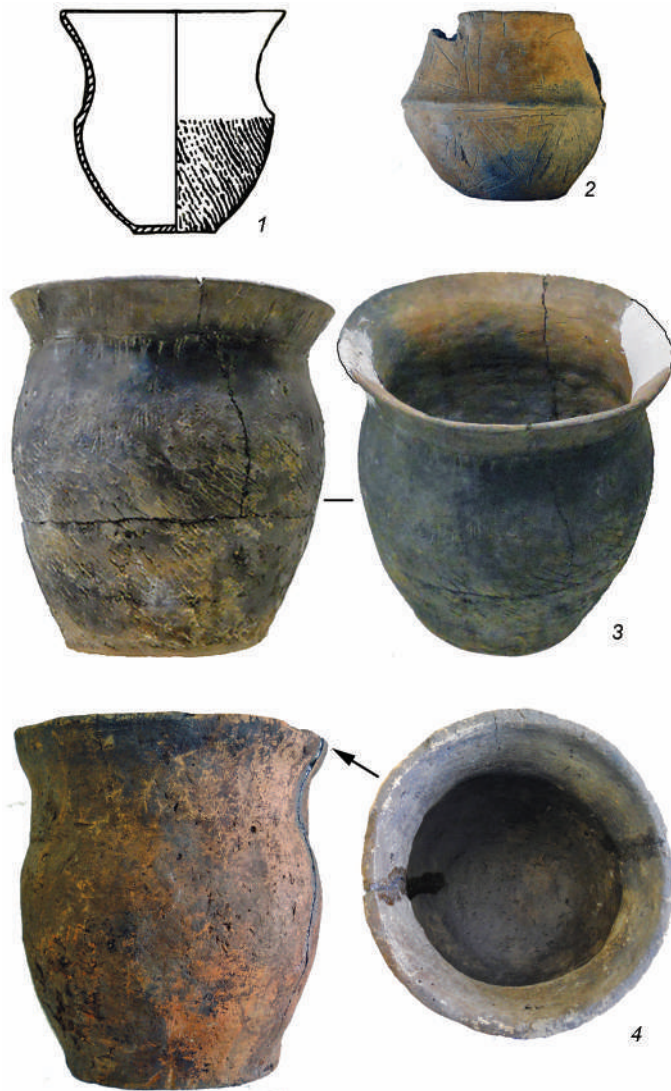
Рис. 1. Керамические сосуды с поселений Сяньянлин (1, 3), Рыбное Озеро (2) и Кочковатка II (4).

1 – по: [Ван Чэншэн и др., 2000, с. 45, рис. 6, 19]; 2, 4 – Музей истории и культуры народов Сибири и Дальнего Востока ИАЭТ СО РАН; 3 – Музей истории г. Цзиньчжоу.