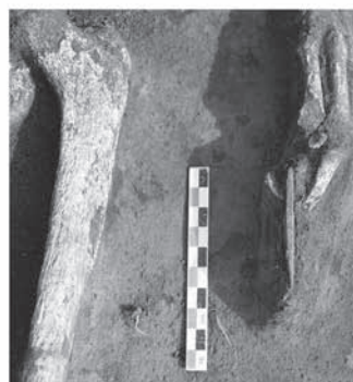
Рис. 1. Погр. № 36 кротовской культуры могильника Усть-Таргасские курганы (поселение Карьер Таи-1): 1 – план: а – игольник; б – шило; в, г – ножевидные пластины; д – отщеп; е – скол со шлифованного орудия; ж – сосуд 1; з – сосуд 2; и – сосуд 3; к – контуры погр. № 36; л – контуры ям; м – фрагменты керамики; н – кость животного; о – фрагменты технической кера- мики; 2 – костяной игольник; 3 – бронзовое шило.