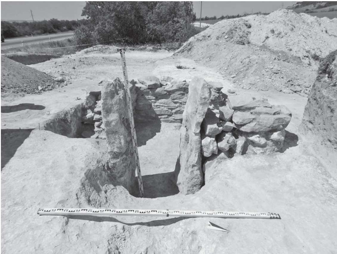
Рис. 4. Холодная Гора-1, склеп. Вид от входа (с востока).