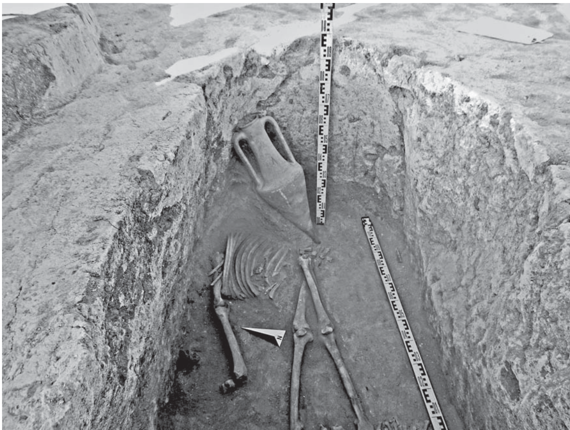
Рис. 3. Амфора в ногах воина. Сары-Су-1, склеп № 7.

младенцев, а также следы тризны с фрагментами битых амфор. Такое необычное сочетание различных типов скифских захоронений в одном кургане в Крыму авторам не известно.