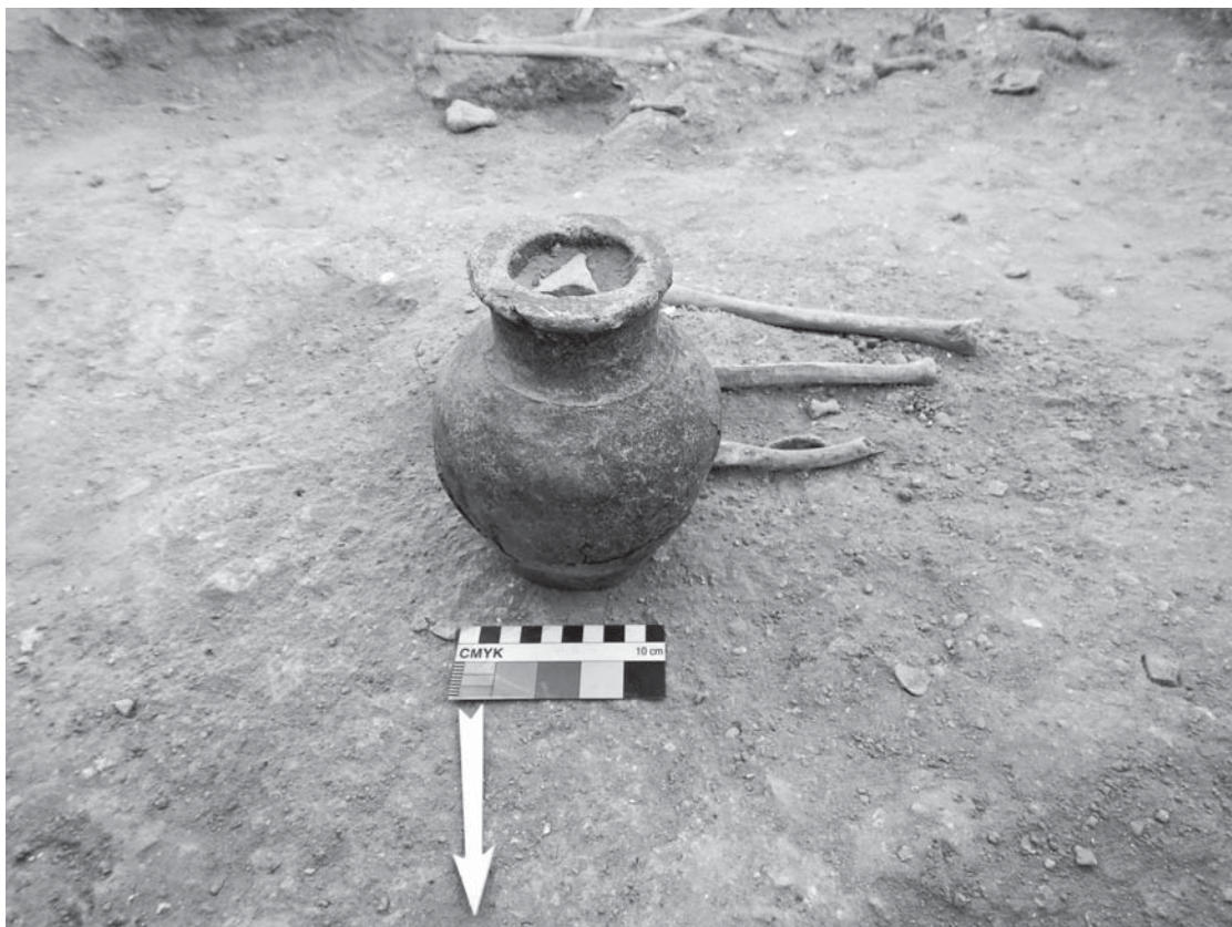
Рис. 5. Керамическая лепная курильница. Холодная Гора-1, склеп.