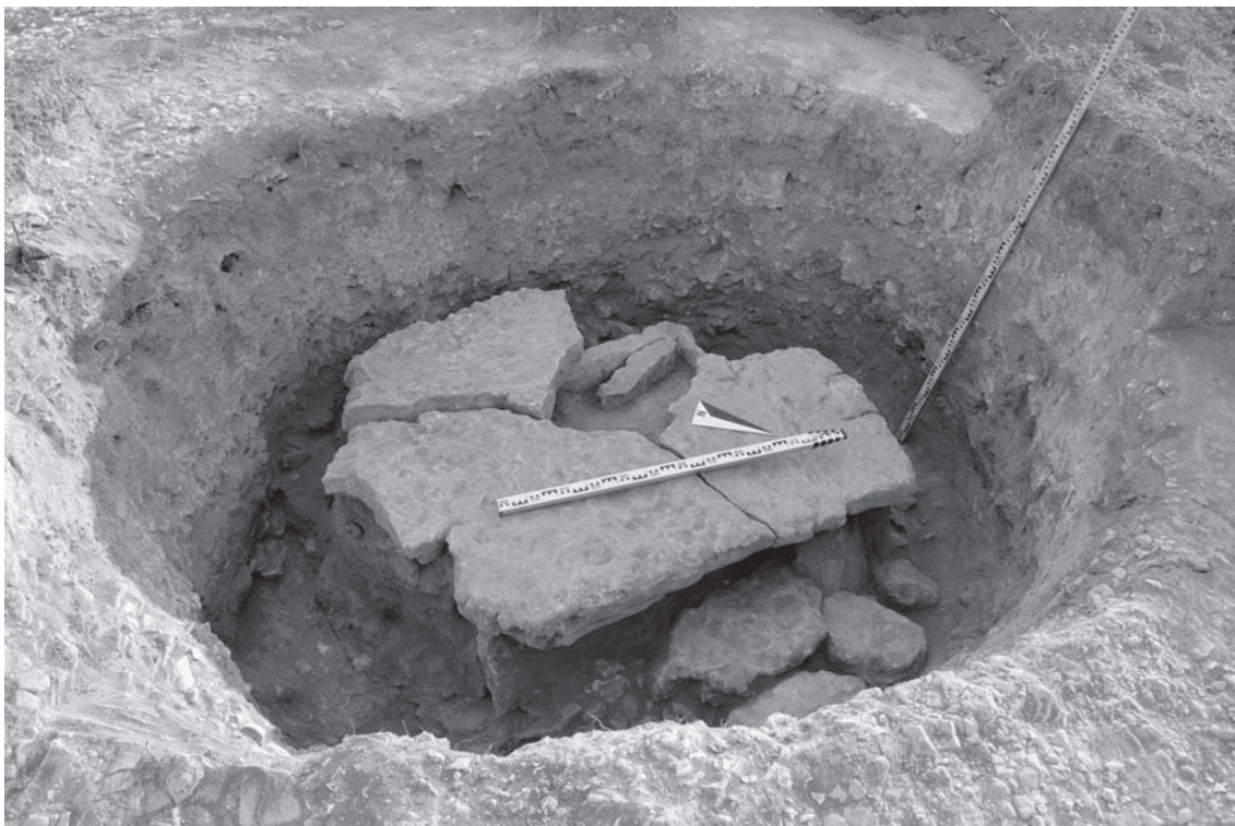
Рис. 2. Каменный ящик кеми-обинского типа с плитой перекрытия. Белая Скала-1.

мер находился примерно на 1,5 м ниже уровня современной поверхности. Закрывавшие лазы входные плиты были отодвинуты или отброшены в древности. Склеп № 7 неоднократно посещался через входную яму злоумышленниками (?), похитившими весь инвентарь и разбросавшими кости нескольких людей. Последний еще не разложившийся погребенный был вытаскен во входную яму склепа и оставлен в положении сидящего, свесившего ноги в погребальную камеру. Рядом лежал обломок бронзовой обоймы (?), предположительно, от украшения его одежды или снаряжения. Соседний склеп № 97, по-видимому, также посещался в древности для сбора вещей, но кости не менее семи умерших при этом не перемещались. Взрослые и дети в склепе ориентировались по-разному: взрослые – головами на запад и восток, а дети – на север. Судя по немногочисленному инвентарю, фрагменту амфоры и конструкции склепа, захоронения относятся к позднескифскому периоду. Похожая грунтовая катакомба с аналогичной ориентацией находилась у центра кургана в Добролюбовке-1. Интересно, что ее погребальная камера также частично уходила под основное захоронение ямной культуры. Начинаясь с востока дромос был заложен камнями и залит глиной. Закрывавший лаз камень находился на месте, но камера оказалась пустой. Лишь у кромки южной стенки сохранилось несколько фаланг и пяточных костей ноги человека.