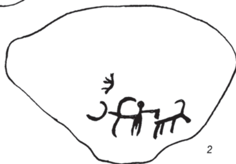
Рисунки на поверхностях каменных валунов – первого (1) и второго (2) – на памятнике Айгыр-Жал.