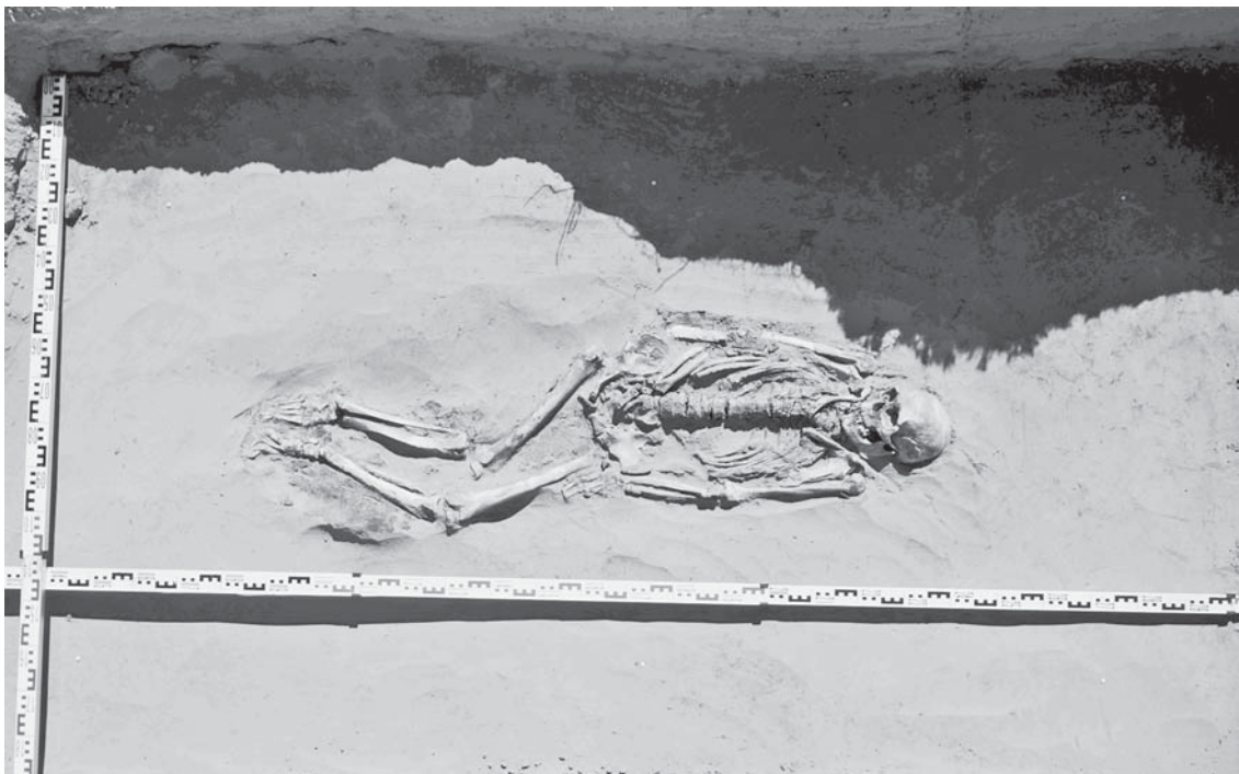
Рис. 3. Погр. 1.2. Вид с запада. Могильник Бухта Находка-2.

Вторая группа представлена десятью погребениями XII–XIII вв. Костные остатки содержались в четырех из них, два погребения повреждены эрозией, остальные четыре – кенотафы.