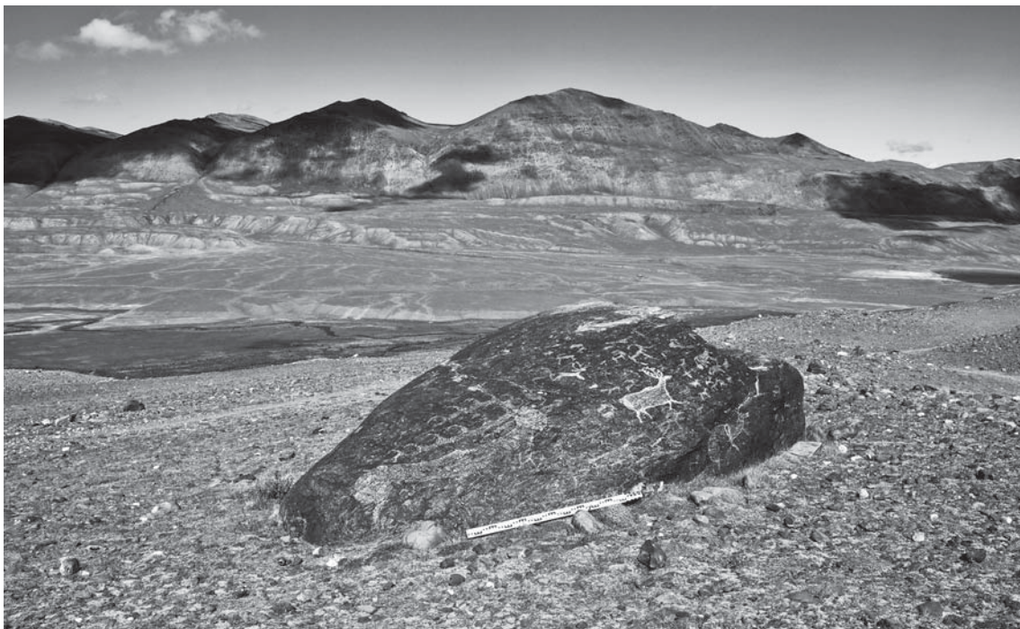
Рис. 1. Общий вид на валун с петроглифами в долине р. Талдура. Российский Алтай.